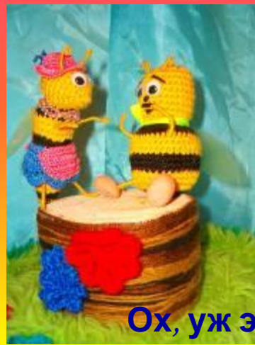
Ох, уж эта любовь