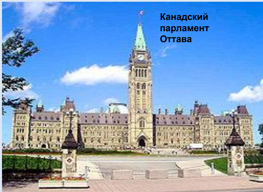
Канадский парламент Оттава