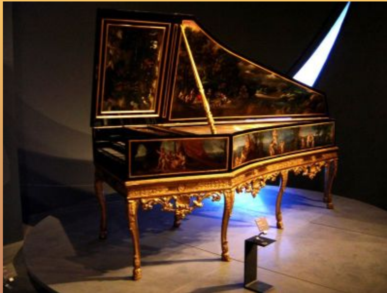
Французский клавесин 17-го века