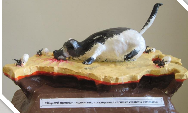
Петербург :выставка памятников взятке — «Борзой щенок»