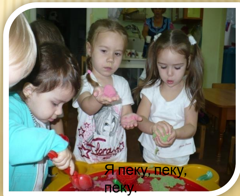
Я пеку, пеку, пеку.