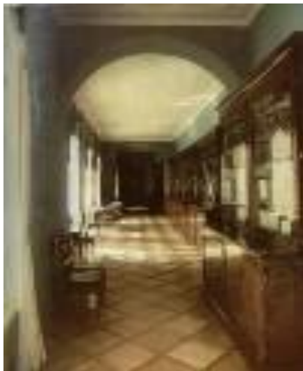
Нижний этаж флигеля. Библиотека