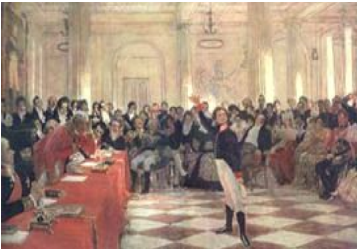
И.Е. Репин «Пушкин на лицейском экзамене в Царском Селе», 1911 г.

8 января 1815 года на испытания по русской словесности приехал великий поэт Г.Р.Державин.