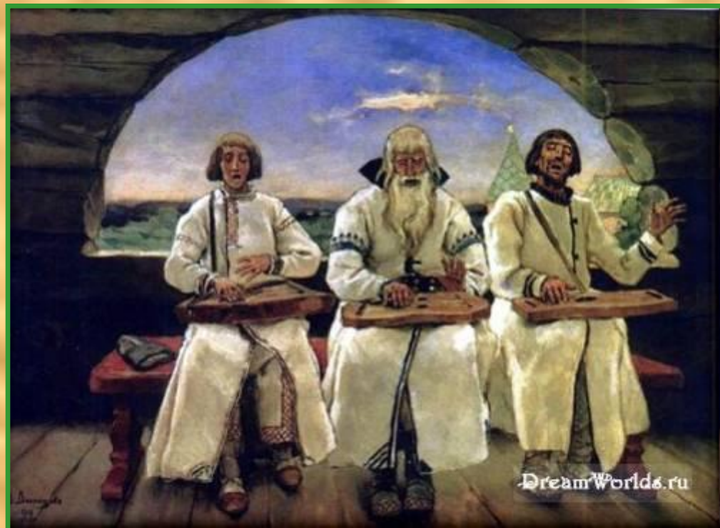
Виктор Михайлович Васнецов «Гусляры»