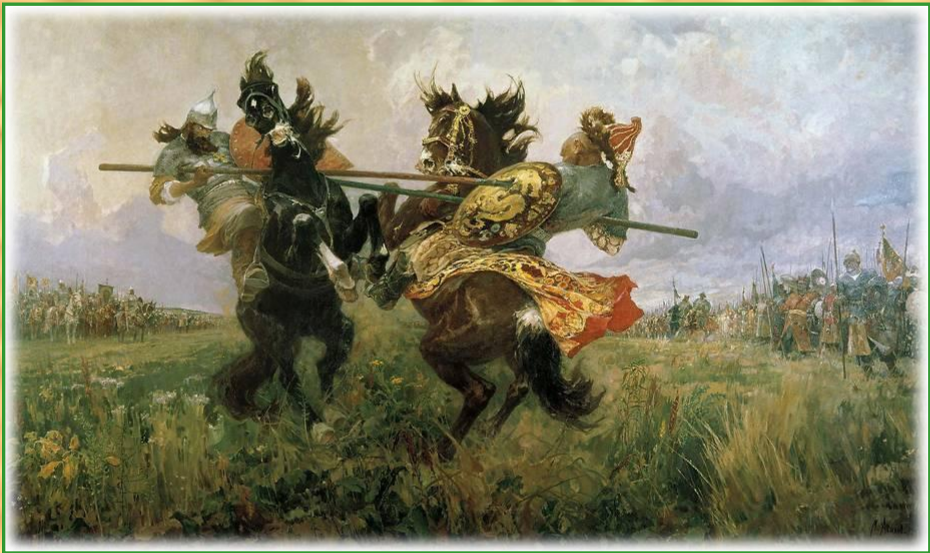
М. И. Авилов. Поединок Пересвета с Челубеем.