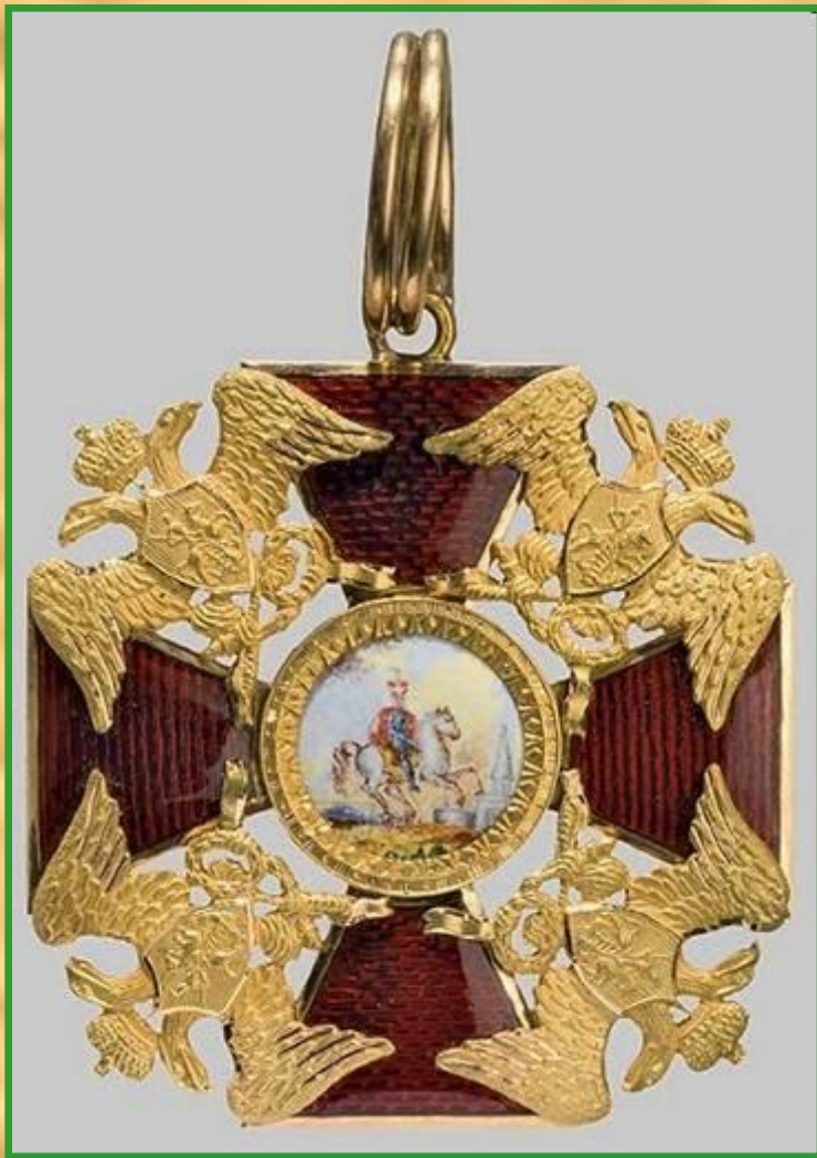
Орден Святого Алекса́ндра Не́вского — государственная награда Российской империи с 1725 до 1917 года.