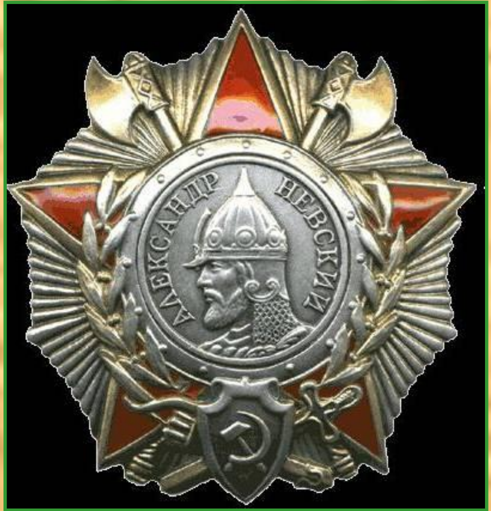
Орден Александра Невского (СССР) — государственная награда СССР в 1942—1991 годах.