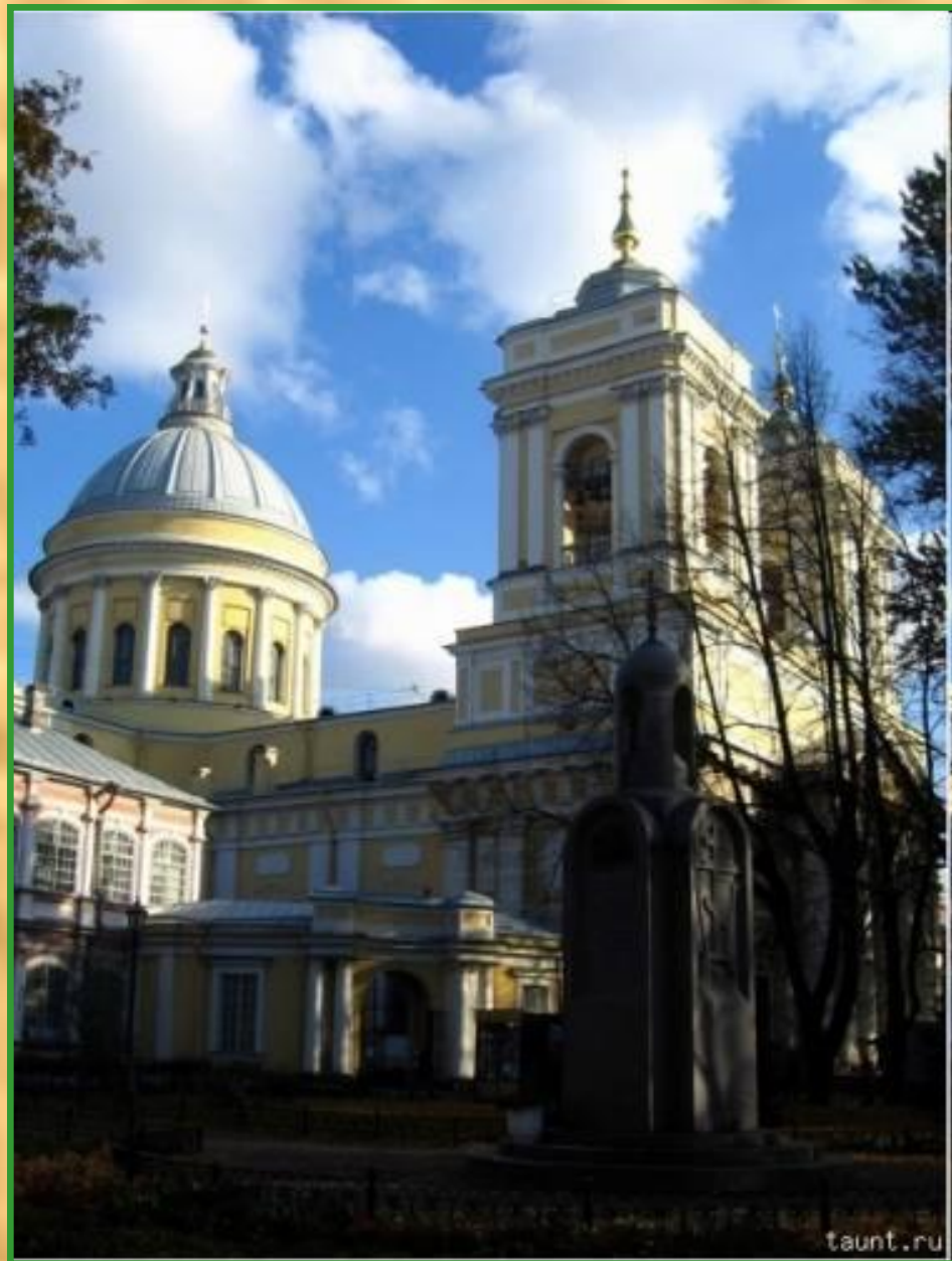
Александро-Невская лавра в Санкт-Петербурге