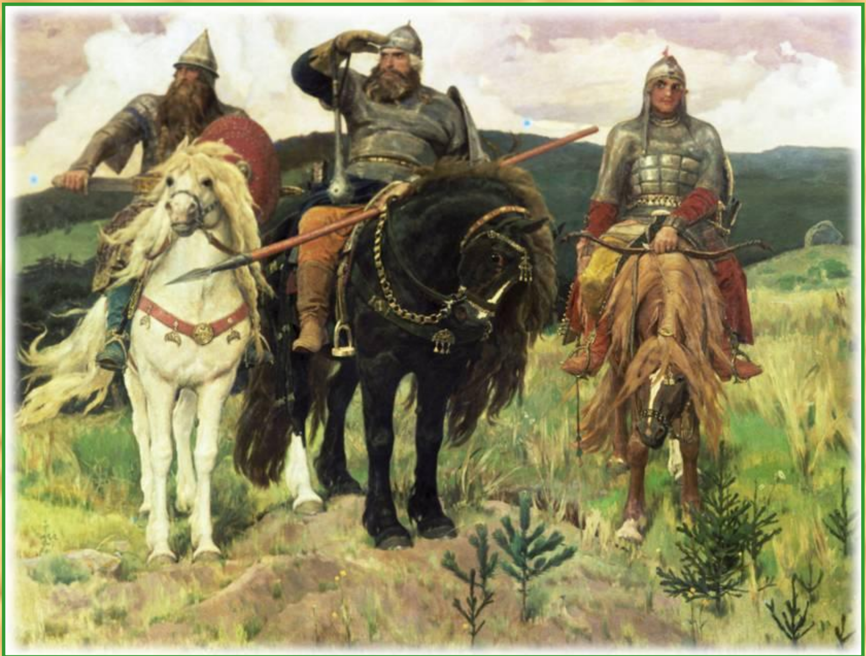
Виктор Михайлович Васнецов «Богатыри»