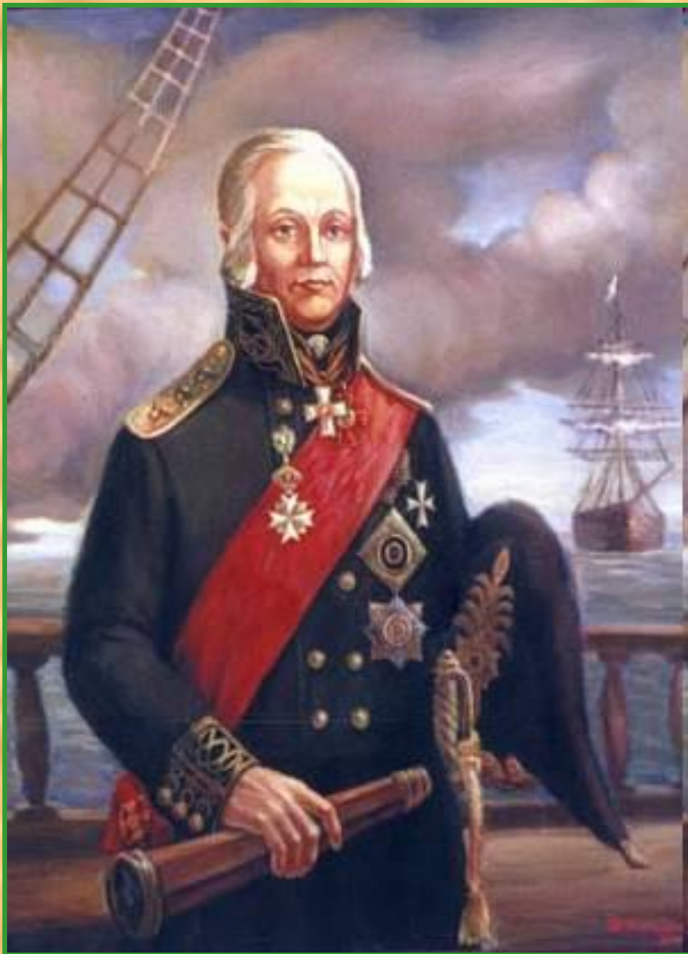
Адмирал Ушаков Фёдор Фёдорович