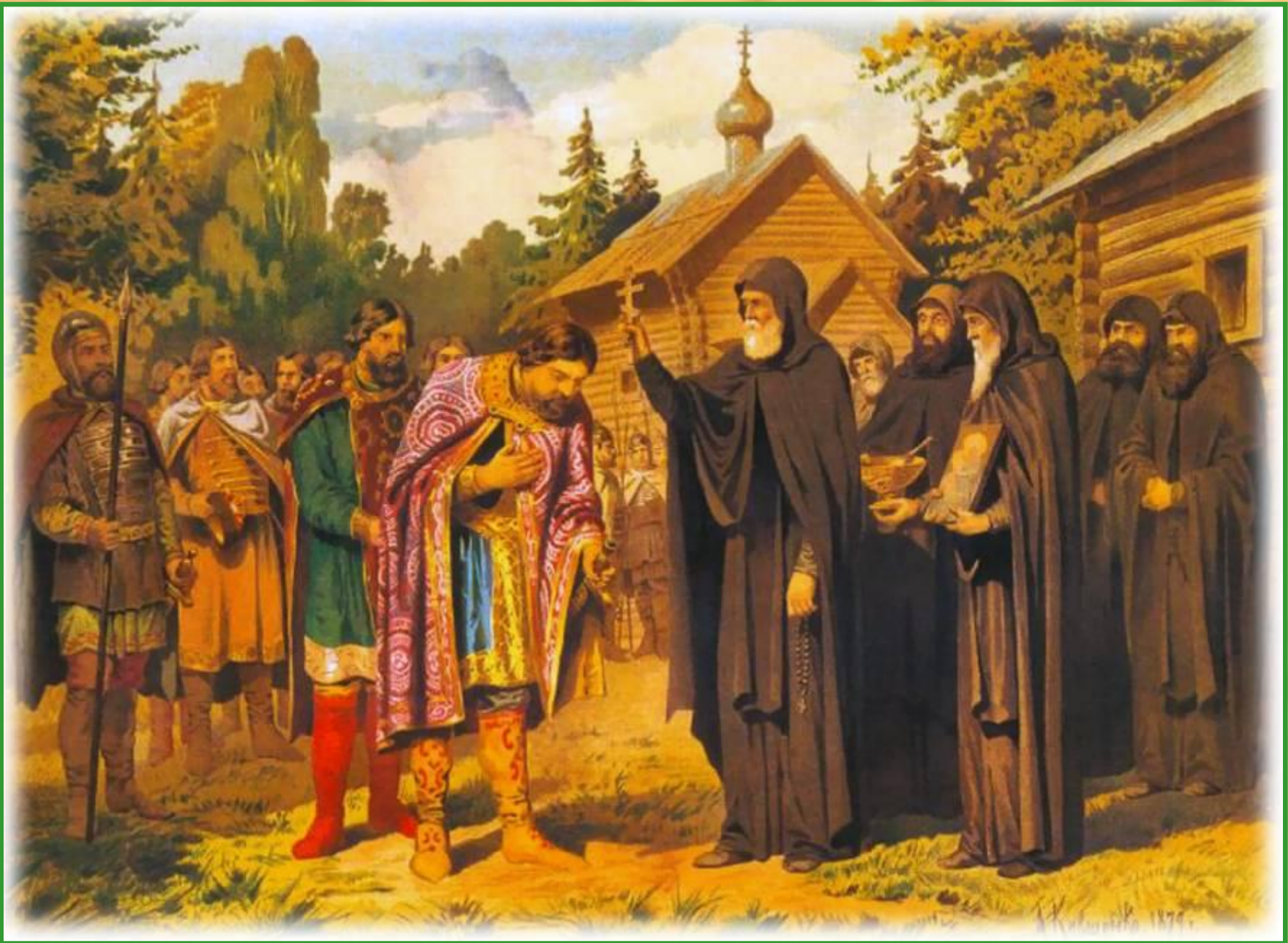
А.Д.Кившенко. Прп. Сергий Радонежский благословляет Дмитрия Донского на Куликовскую битву.