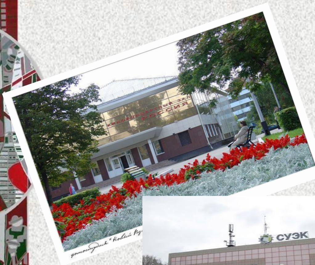
гостиница "Кольевый Ву"

Затерялся в глубине России, За Уралом в далекой Сибири, Средь тайги и глубоких болот, Киселёвск-небольшой городок.