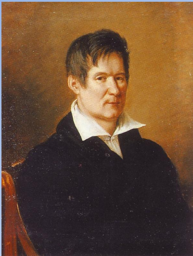
В.П. Стасов 1769-1848

Также В.П. Стасовым был сооружён комплекс здания Академии наук, Ямской рынок (1817-1819), Павловские казармы (1817-1821), Спасо-Преображенский собор (1827-1829), Троице-Измайловский собор (1828-1835), Нарвские Триумфальные ворота (1827-1834) и Московские Триумфальные ворота. Также он произвёл перестройку Китайской деревни в Царском селе (1817-1822) и резиденции вильнюсского генерал-