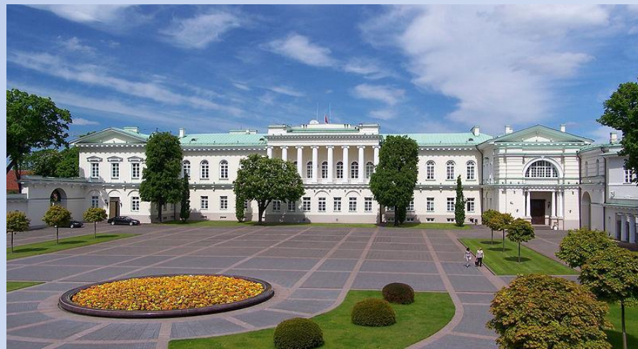
Резиденция президента Литвы