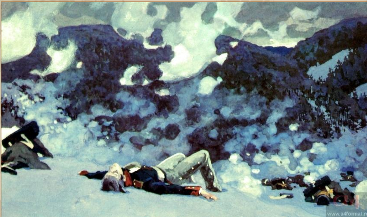
Князь Андрей на Праценской горе. Художник А. Николаев

Здесь, на Праценской горе, почти в бреду, князь Андрей переживет минуты, которые во многом изменят его жизнь, определят все его будущее. Он услышит голоса и поймет французскую фразу, сказанную над ним: — «Вот прекрасная смерть!»