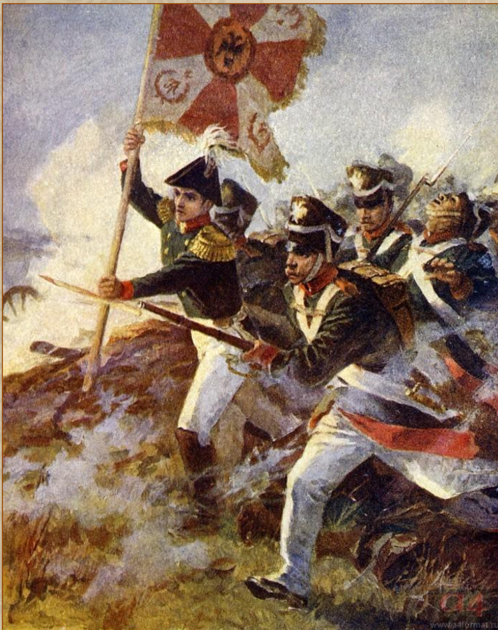
Князь Андрей со знаменем в руках в атаке под Аустерлицем. Художник В. Серов, 1951–1953

В сценах Аустерлицкого сражения и предшествующих ему эпизодах преобладают обличительные мотивы. Писатель раскрывает антинародный характер войны, показывает преступную бездарность русско-австрийского командования. Не случайно Кутузов был по существу отстранен от принятия решений. С болью в сердце полководец сознавал неизбежность поражения русской армии.