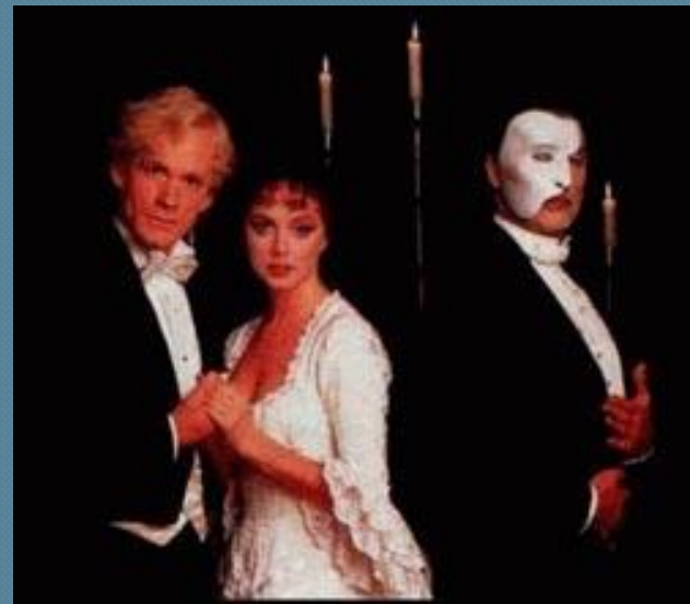
Э.Л.Уэббер мюзикл «Призрак оперы»