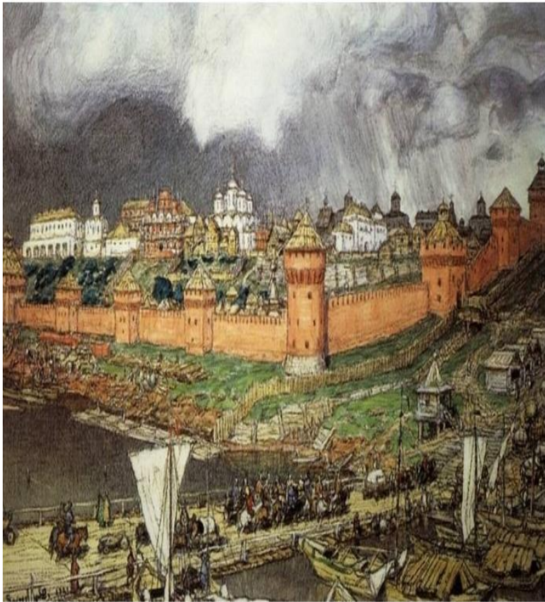
Московский кремль в VI веке