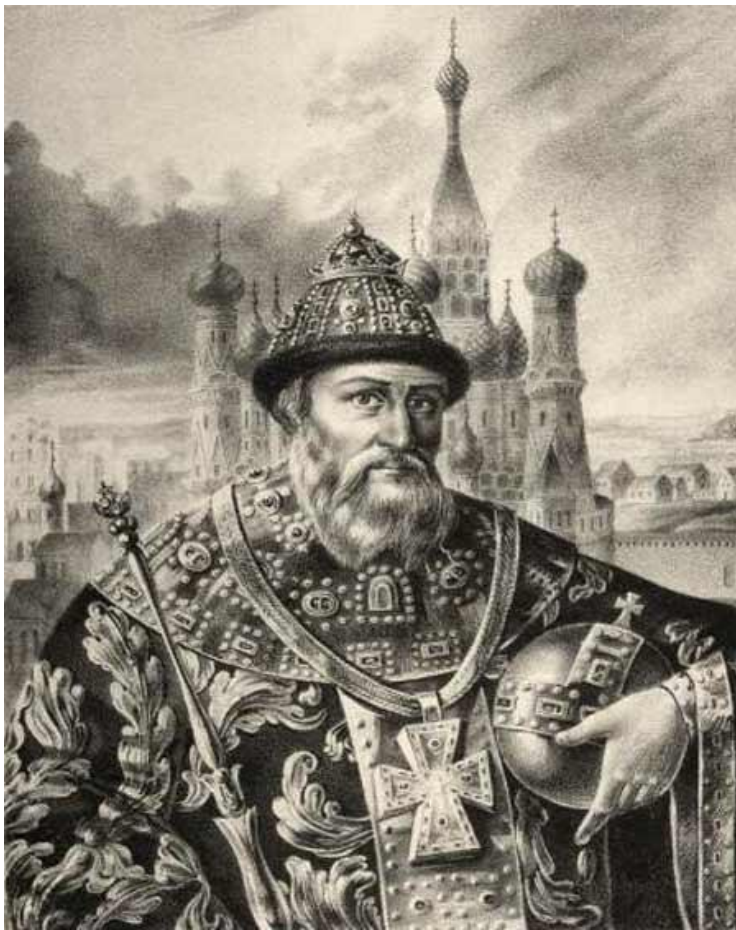
Иван IV Грозный