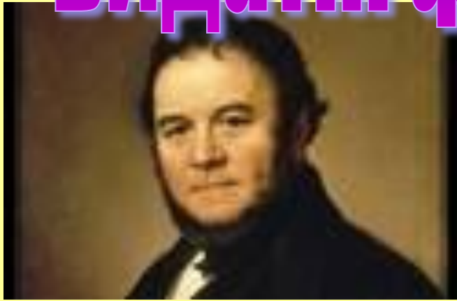
Марі Бейль Стендаль