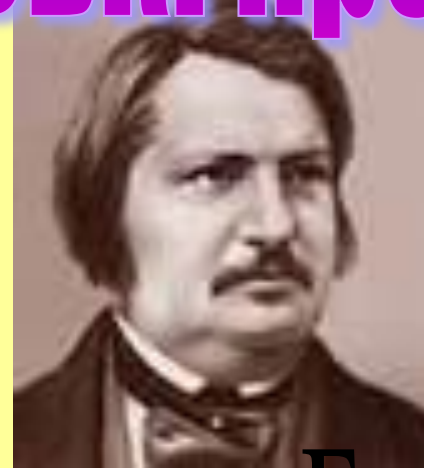
Оноре де Бальзак

Моральний вибір або моральні якості і бідність, або моральне падіння й успіх і процвітання в суспільстві