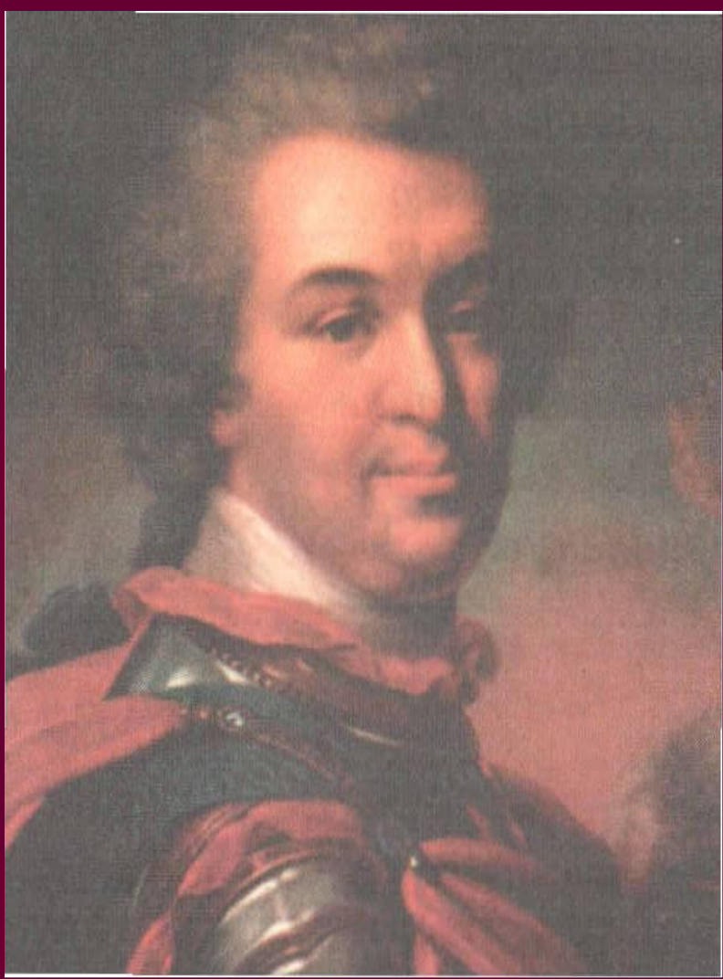
Григорий Александрович Потемкин

В 1773 г. русская армия перешла Дунай. Возобновив военные действия против Турции. Главными силами командовал П. А. Румянцев, другими корпусами – генералы Г.А. Потемкин и А.В. Суворов.