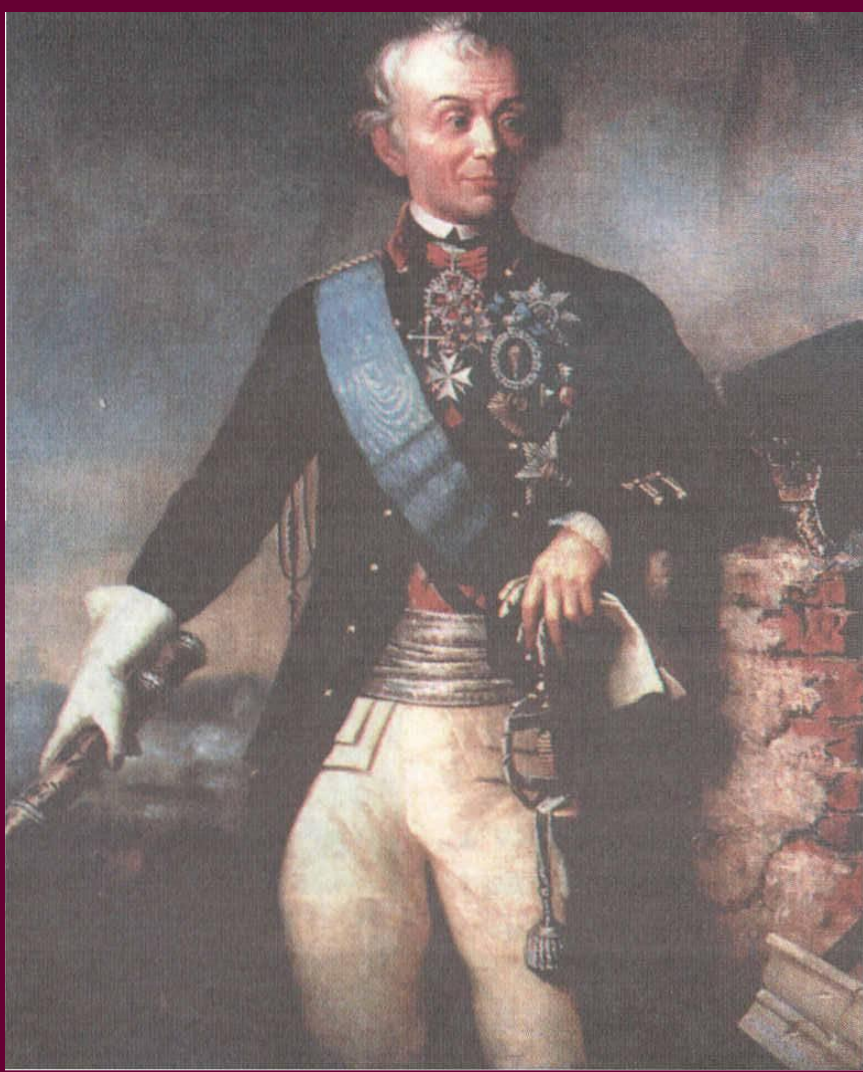
Александр Васильевич Суворов

В 1787 г. Турция потребовала от России вернуть Крым и признать верховенство Османской империи над всей Грузией. Россия отказала, началась вторая русско-турецкая война.