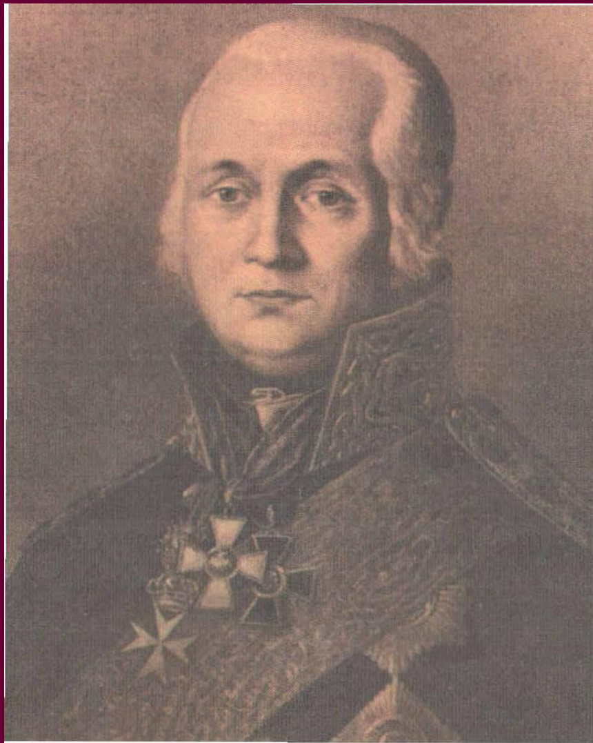
Федор Федорович Ушаков

Успешно развивались операции на море. Черноморский флот под командованием Ф.Ф. Ушакова одержал победы над турками в сражениях близ устья Дуная и Керченского пролива и перенес свои действия к западным берегам Черного моря, где близ мыса Калиакрия наголову разгромил турецкую эскадру.