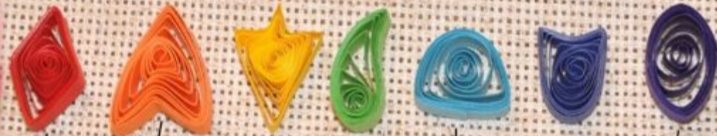
"Ромб" "Стрела" "Ладья" "Крыло" "Полукруг" "Тюльпан" "Овал"