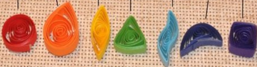
"Спираль" "Капля" "Глаз" "Треугольник" "Листик" "Месяц" "Квадрат"