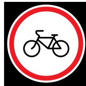
Знак 3.9 «Движение на велосипедах запрещено»