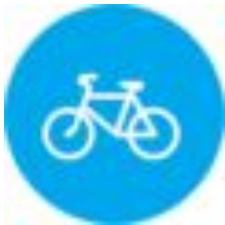
Знак 4.4 «Велосипедная дорожка»