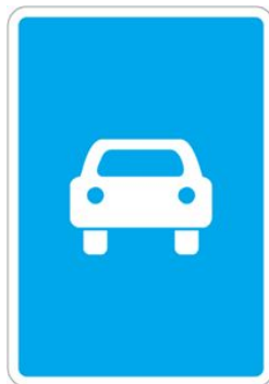
Знак 5.3 «Дорога для автомобилей»