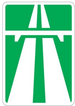
Знак 5.1 «Автомагистраль»