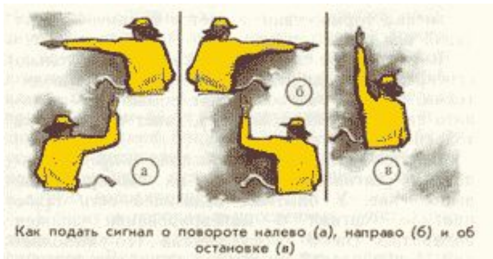
Как подать сигнал о повороте налево (а), направо (б) и об остановке (в)

Как подать сигнал о повороте налево(а), направо (б) и об остановке (в).