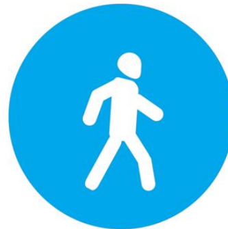
Знак 4.5 «Пешеходная дорожка»

За нарушение ПДД велосипедистами предусмотрена административная ответственность.