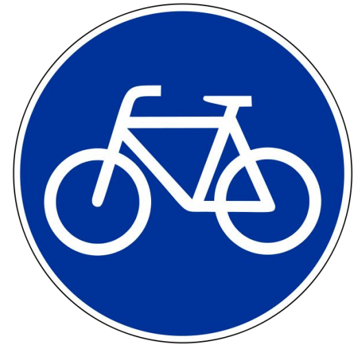
Знак 4.4 «Велосипедная дорожка»