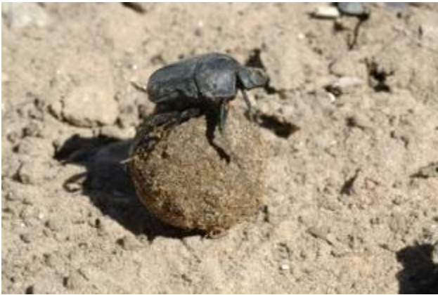
Жук - навозник