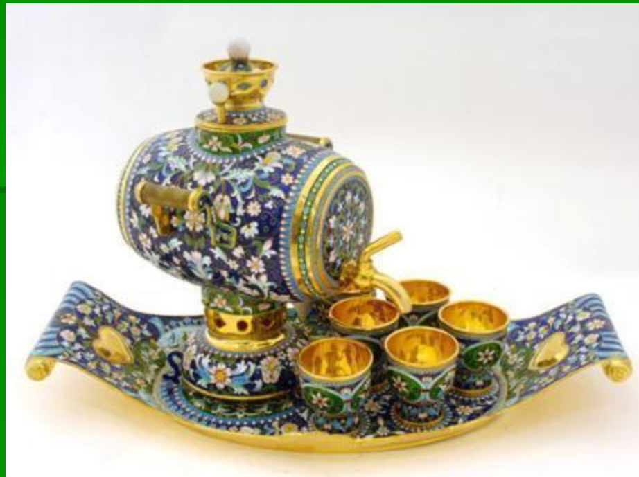
Самовар с чашками на подносе, конец XIX века