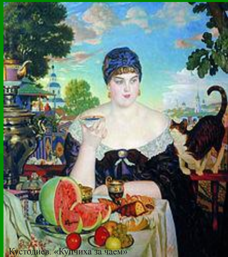
Кустодиев. «Купчиха за чаем»

Для крестьян чай был почти недоступен. Они пили его лишь в особых случаях. Поэтому и возникло выражение «чайком побаловаться».