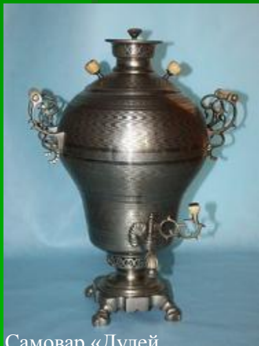
Самовар «Дулей гравированный». Паровая самоварная фабрика наследников П. Н. Фомина в Туле. (1898—1919 гг.)