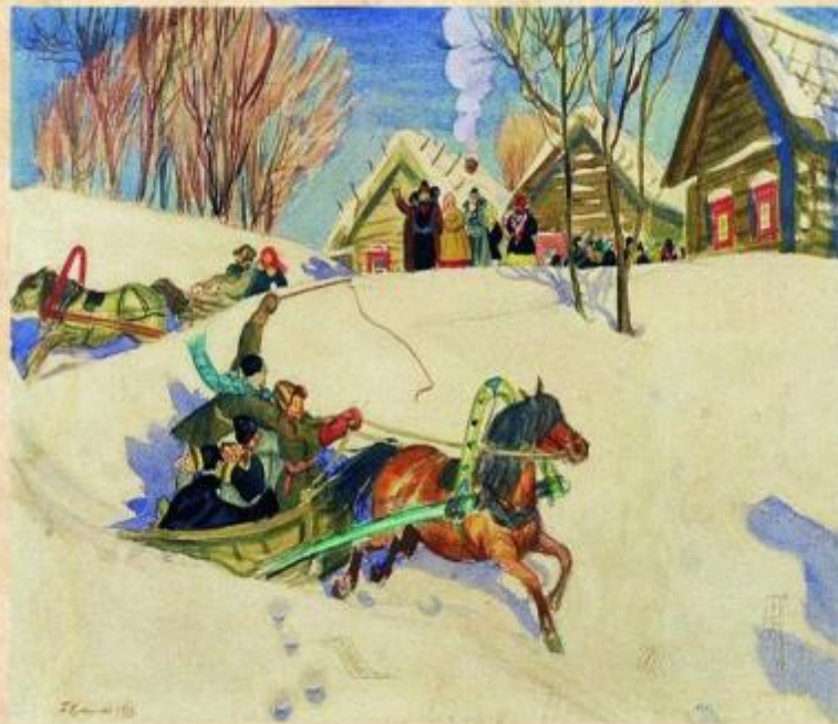
Четверг - РАЗГУЛ

Четверг «Разгуляй». В четверг люди устраивали традиционное катание на лошадях «по солнышку» (то есть, в направлении часовой стрелки вокруг деревни) - разумеется, чтобы помочь небесному светилу прогнать зиму окончательно. А главным «мужским» делом считалась оборона или взятие «снежного городка». Народ разбивался на две команды, причём одна занимала позиции весны, а вторая отчаянно «защищала» зиму. В конечном итоге весна обязательно побеждала.