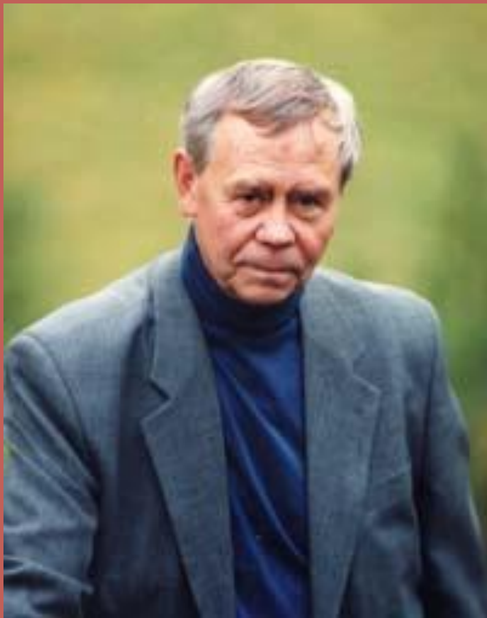
Валентин Распутин 1937г.р.