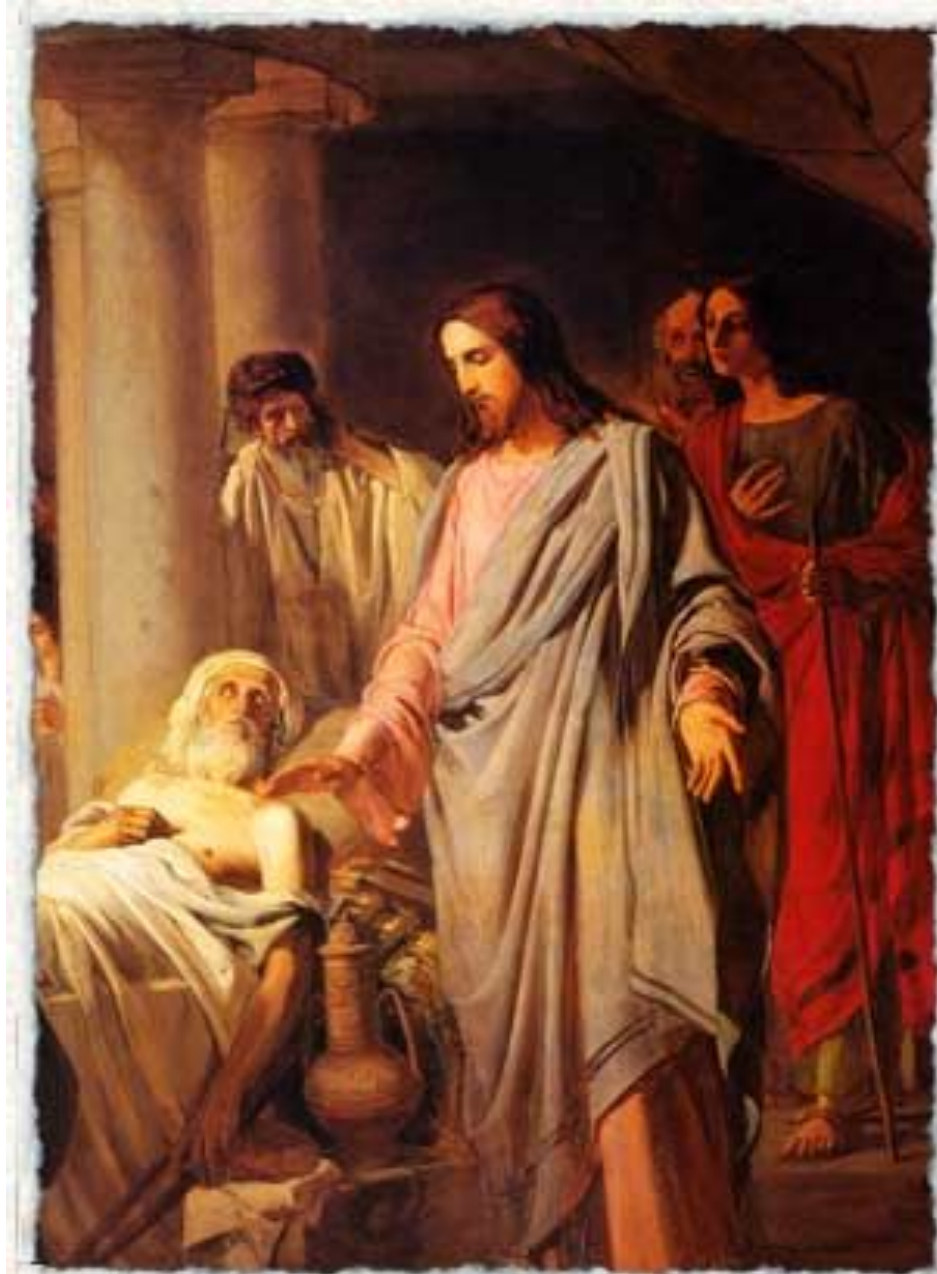
1885 г. Николай Бруни. Овчая купель (исцеление расслабленного). Деталь. Х/м. 166x207. Русский музей, Петербург.

милосердное исцеление прощение грехов попрание гордыни