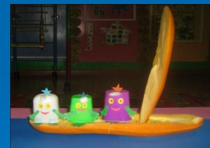
« Путешествие на кораблике»