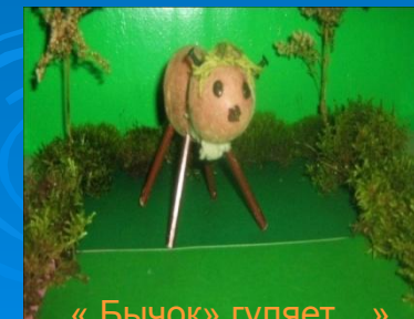
« Бычок» гуляет...»