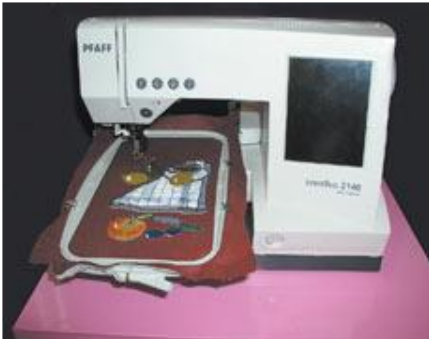
Компьютеризированная швейно-вышивальная машина „ПФАФФ 2140“ и образец вышивки, сделанной на ней.