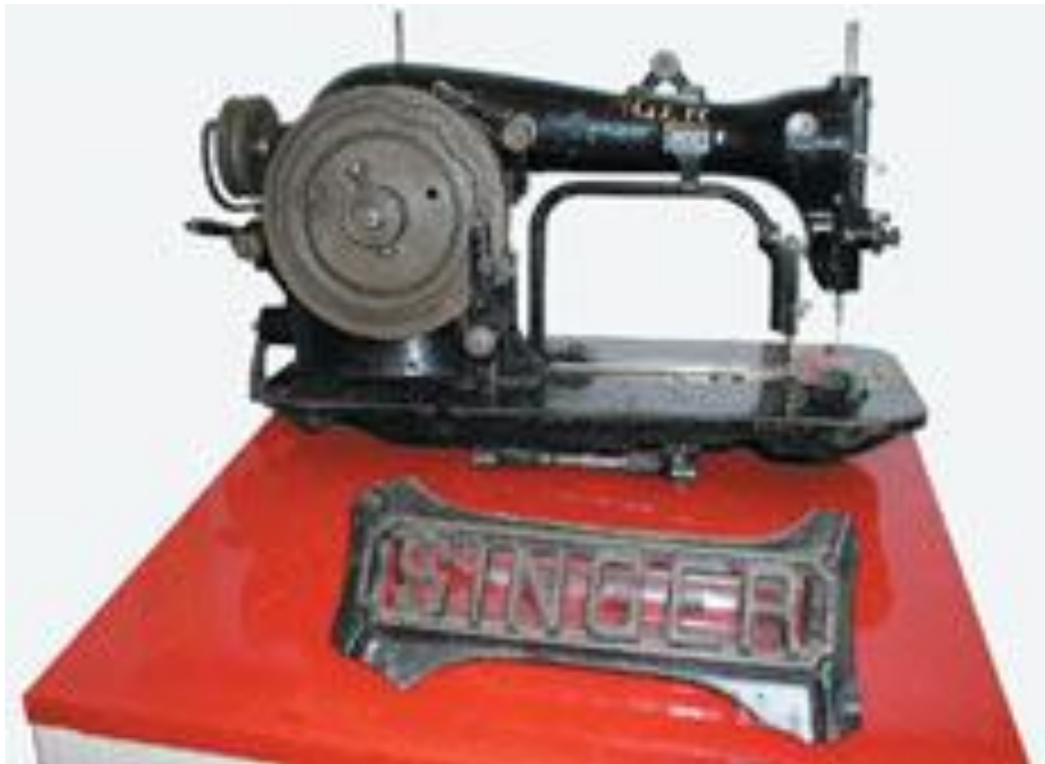
Швейная машина фирмы „Зингер“ (США, 1900-1915), предназначенная для изготовления закрепок и укрепления петель, пришивания бантиков к обуви и платью.