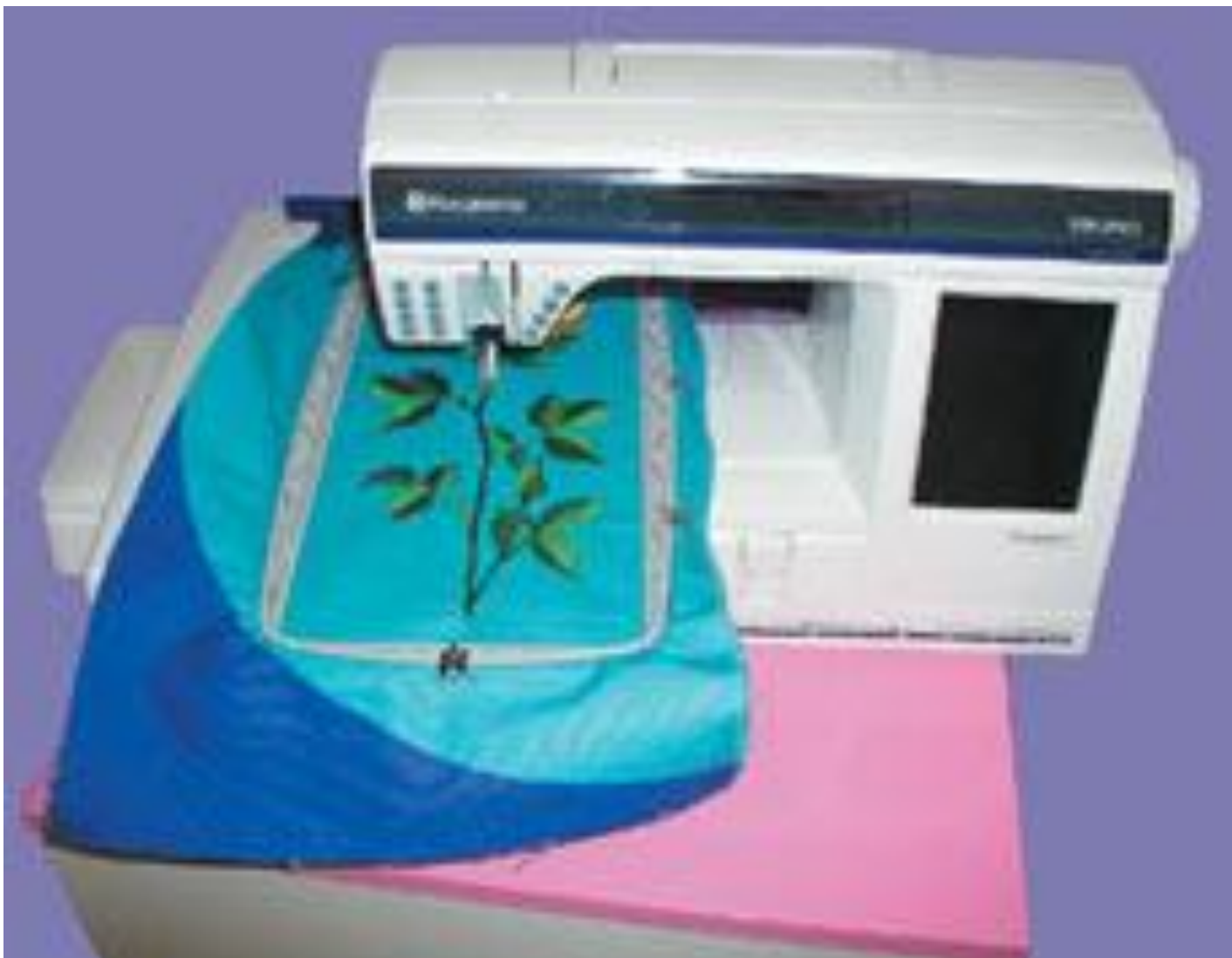
Компьютеризированная швейно-вышивальная машина „ХУСКВАРНА ВИКИНГ“ с образцом вышивки.