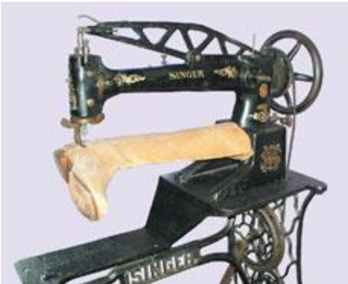
Сапожная швейная машина челночного стежка для сшивания головок и голенищ обуви (подольский завод компании „Зингер“, 1902-1917).