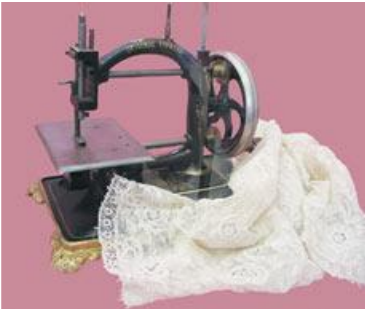
Швейная машина „Оригиналь экспресс“ цепного стежка (США, 1860-1880). Основание выполнено в технике художественного литья, что соответствует технической моде второй половины XIX века.