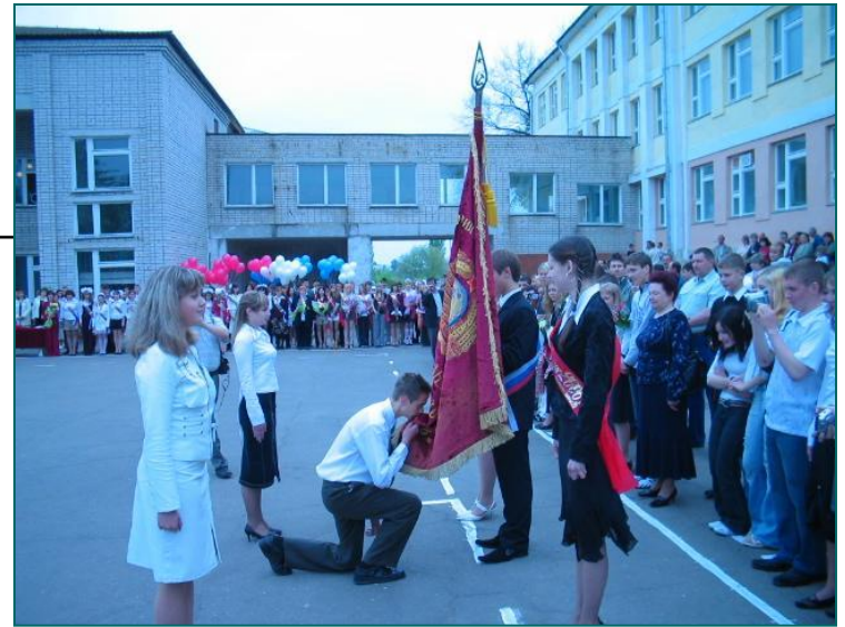
Прощание со Знаменем лица