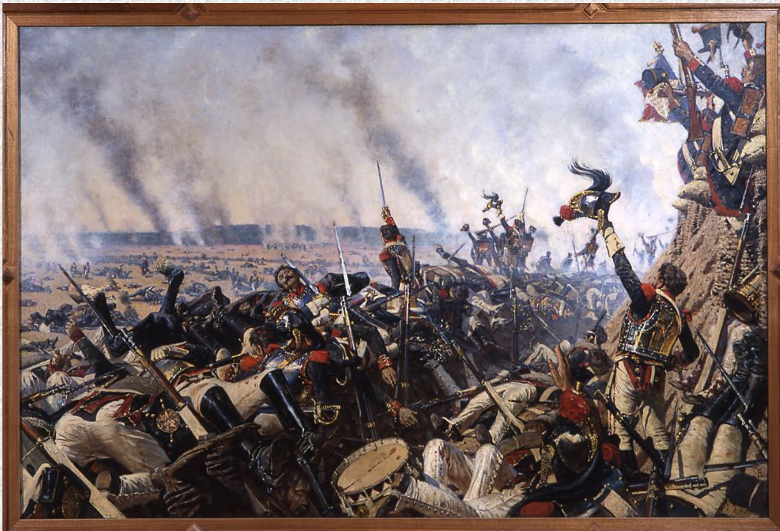
В.Верещагин. Конец Бородинского сражения