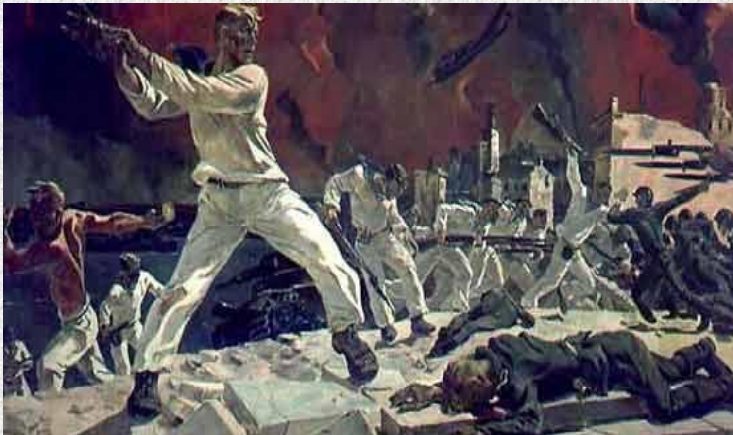
А. Дейнека. « Оборона Севастополя »