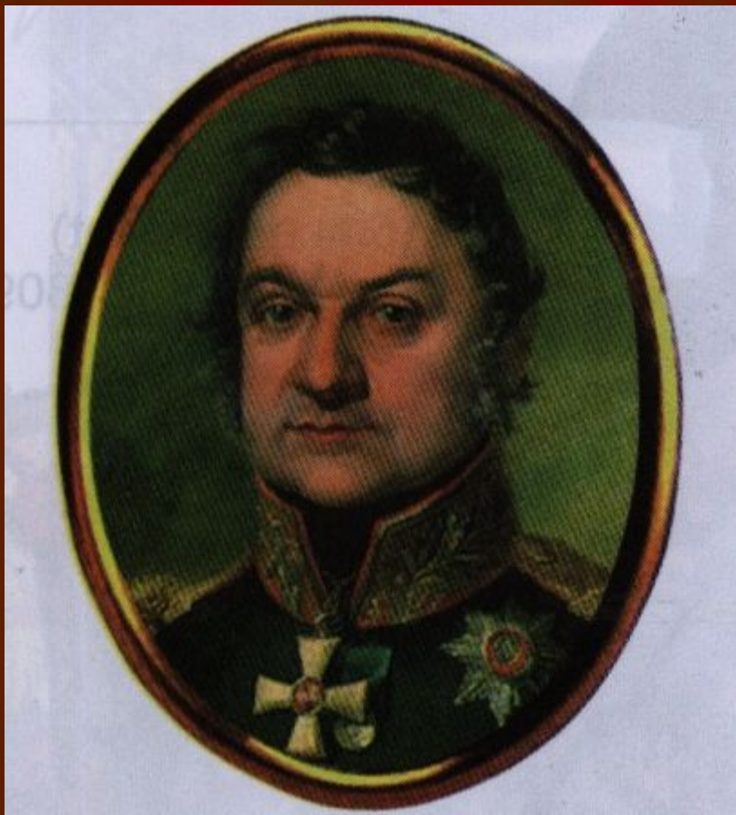
Генерал от инфантерии Дмитрий Сергеевич Дохтуров