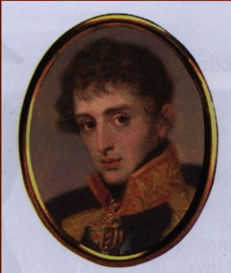
Генерал-майор Александр Алексеевич Тучков 4-й