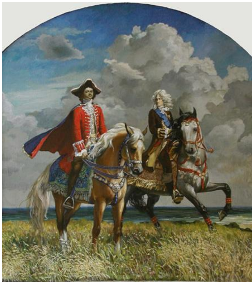
Панцырев Юрий, Петр I и А.Д.Меньшиков