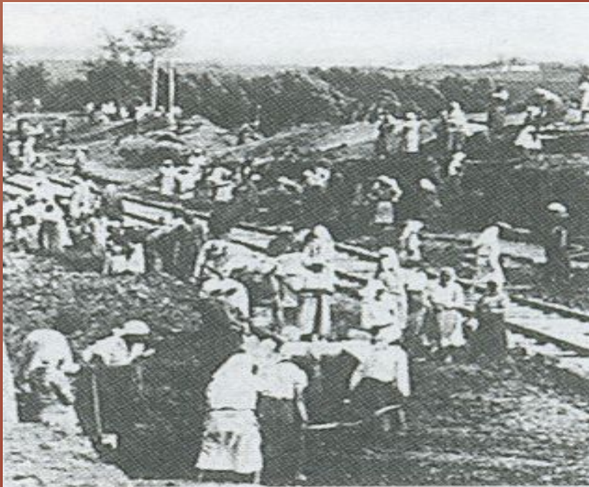
Строительство железной дороги Старый Оскол — Ржава

Военный совет обратился в ГКО с просьбой о срочном сооружении новой железной дороги. 8 июня 1943 года ГКО принял постановление «О строительстве линии Старый Оскол – Ржава » протяженностью 95 километров