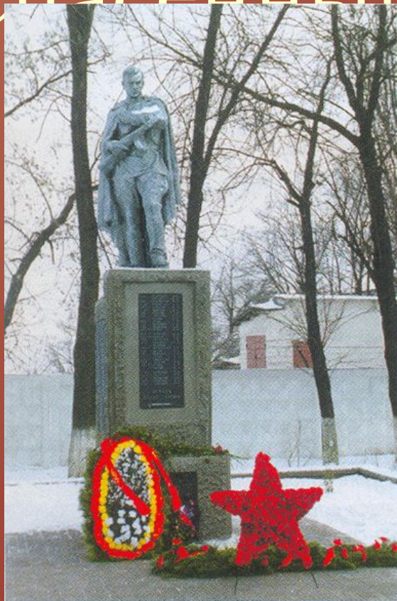
Братская могила советских воинов в г. Старый Оскол