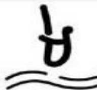
прыжки в воду