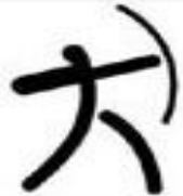
стрельба из лука