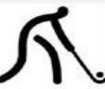
хоккей на траве