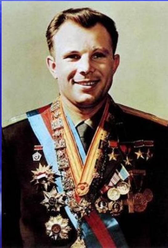
Юрий Алексеевич Гагарин