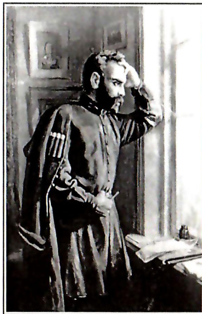
«Коста в Херсонской ссылке». Художник А.В.Джанаев.