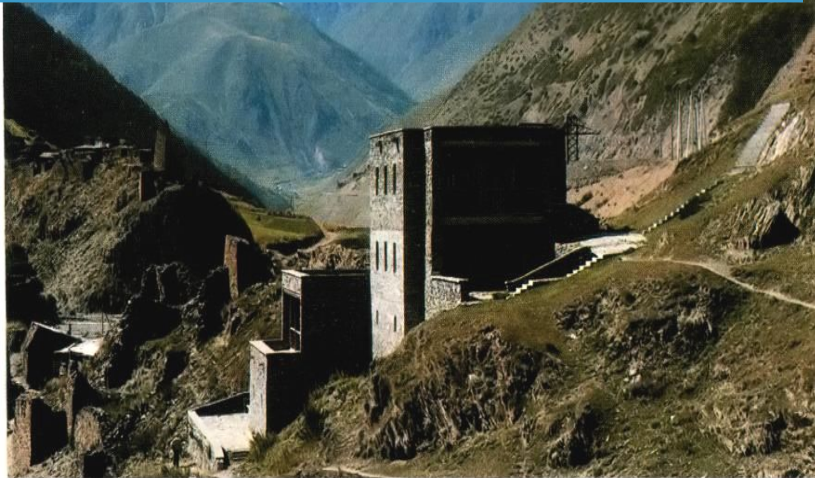
Аул Нар. Музей Коста Хетагурова