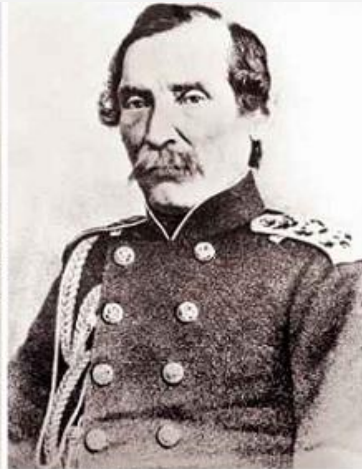
Е. В. Путятин