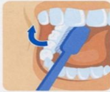
2. Внутренние поверхности зубов