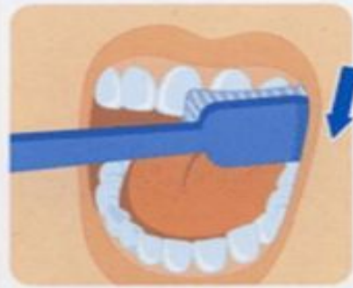
1. Наружные поверхности зубов