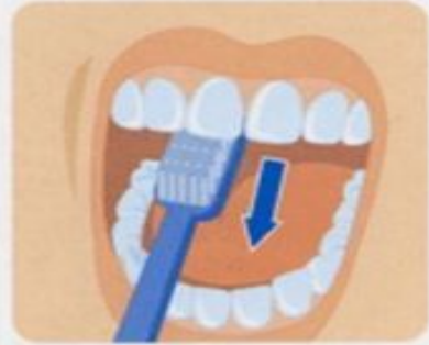
3. Внутренние поверхности передних зубов