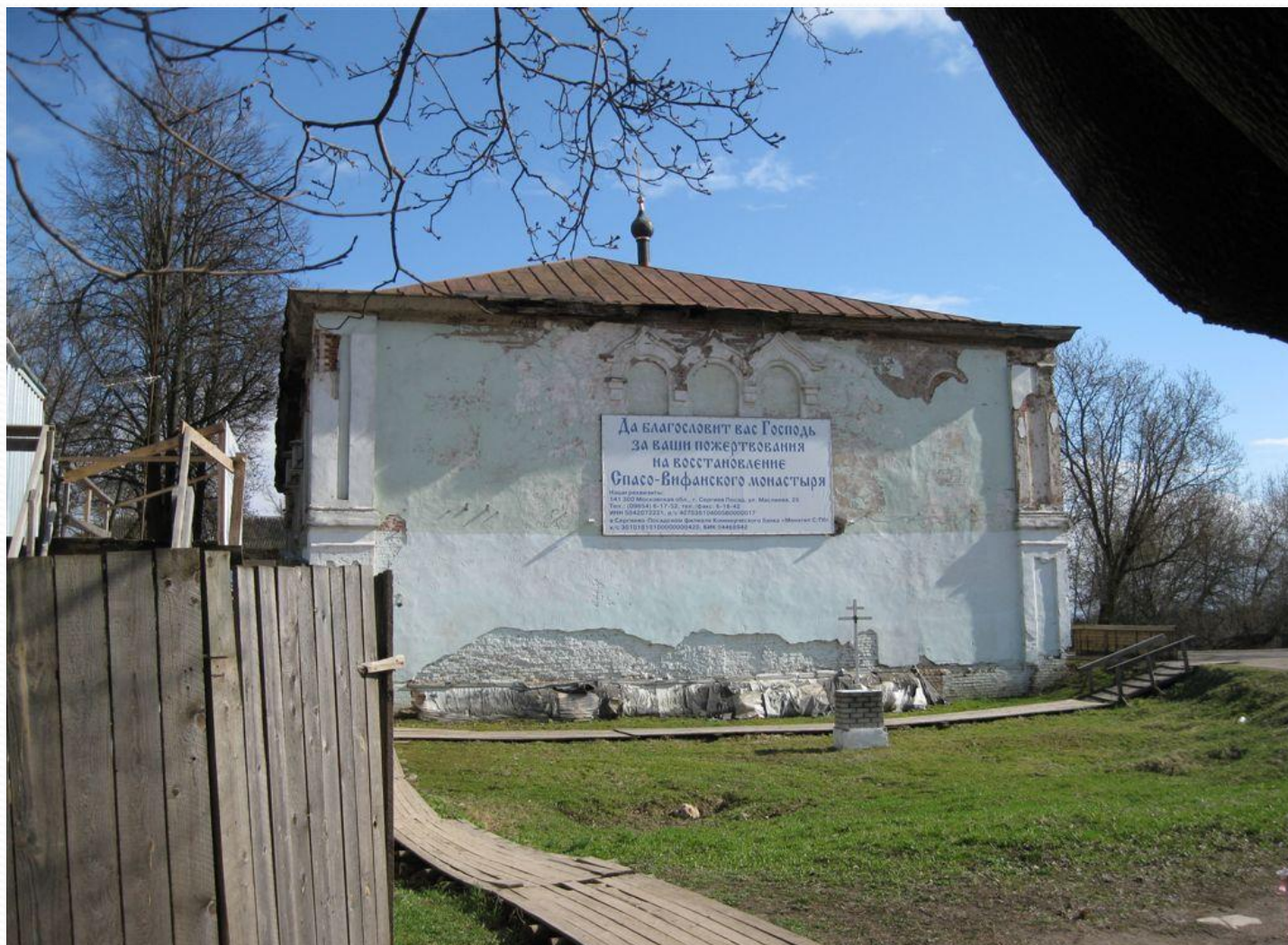
Храм Сошествия Святого Духа с приделом в честь Николая Чудотворца