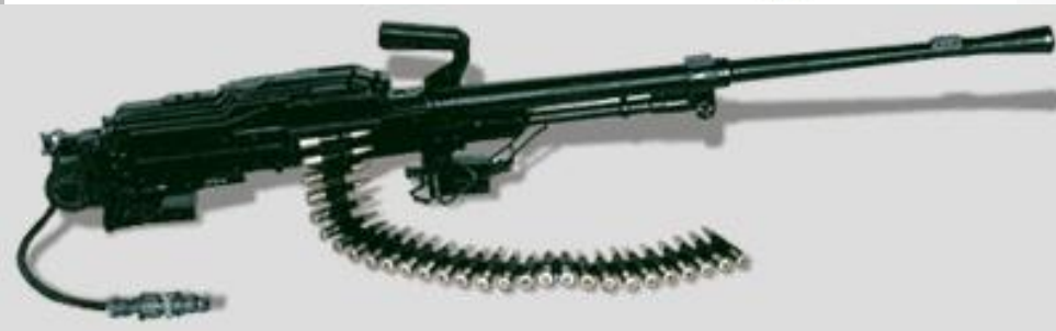
Танковый пулемет ПКМТ