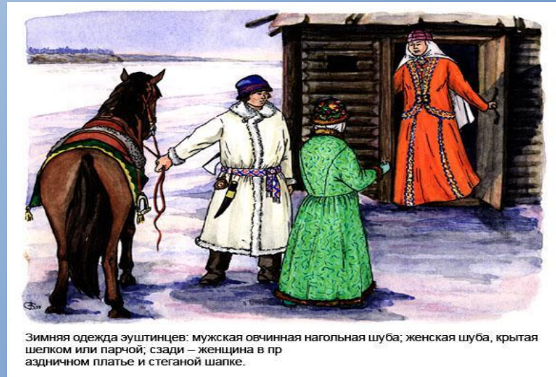
Зимняя одежда эуштинцев: мужская овчинная нагольная шуба; женская шуба, крытая шелком или парчой; сзади – женщина в пр аздничном платье и стеганой шапке.