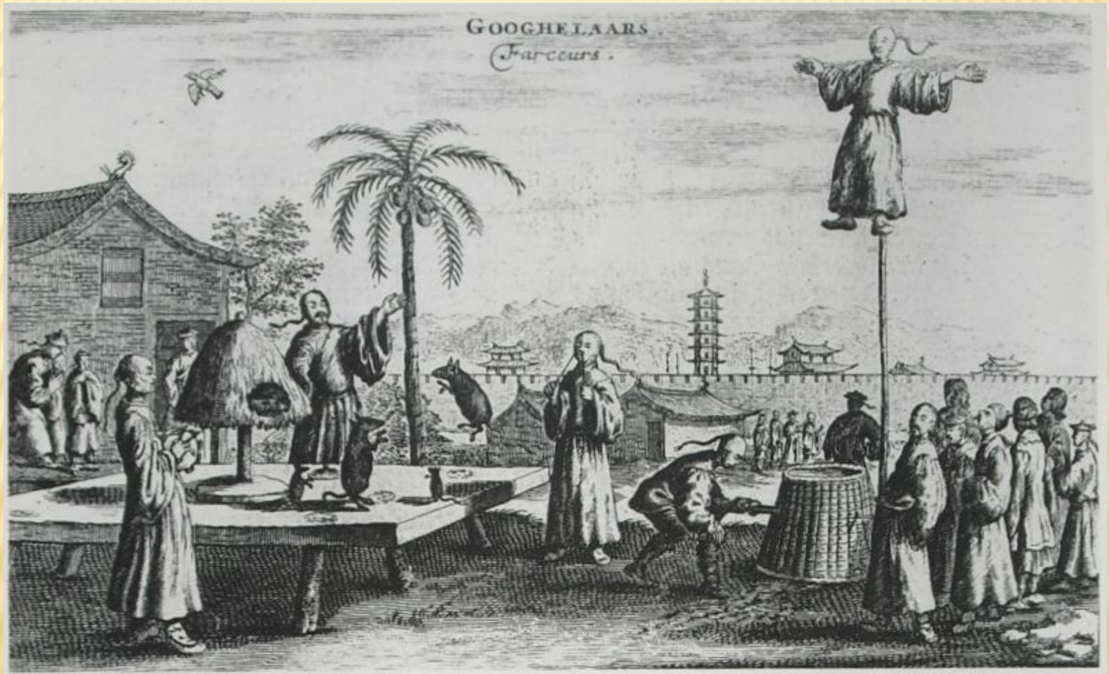
Бродячие циркачи в Китае, ок. 1655-57 гг.