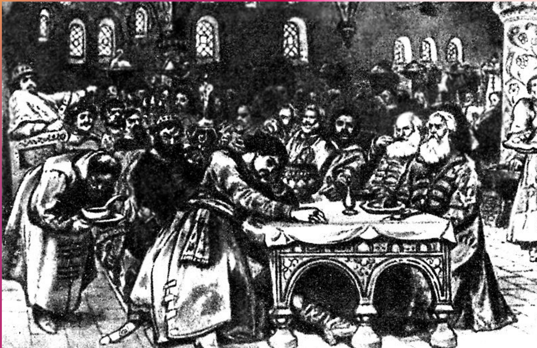
Сцена пира у царя