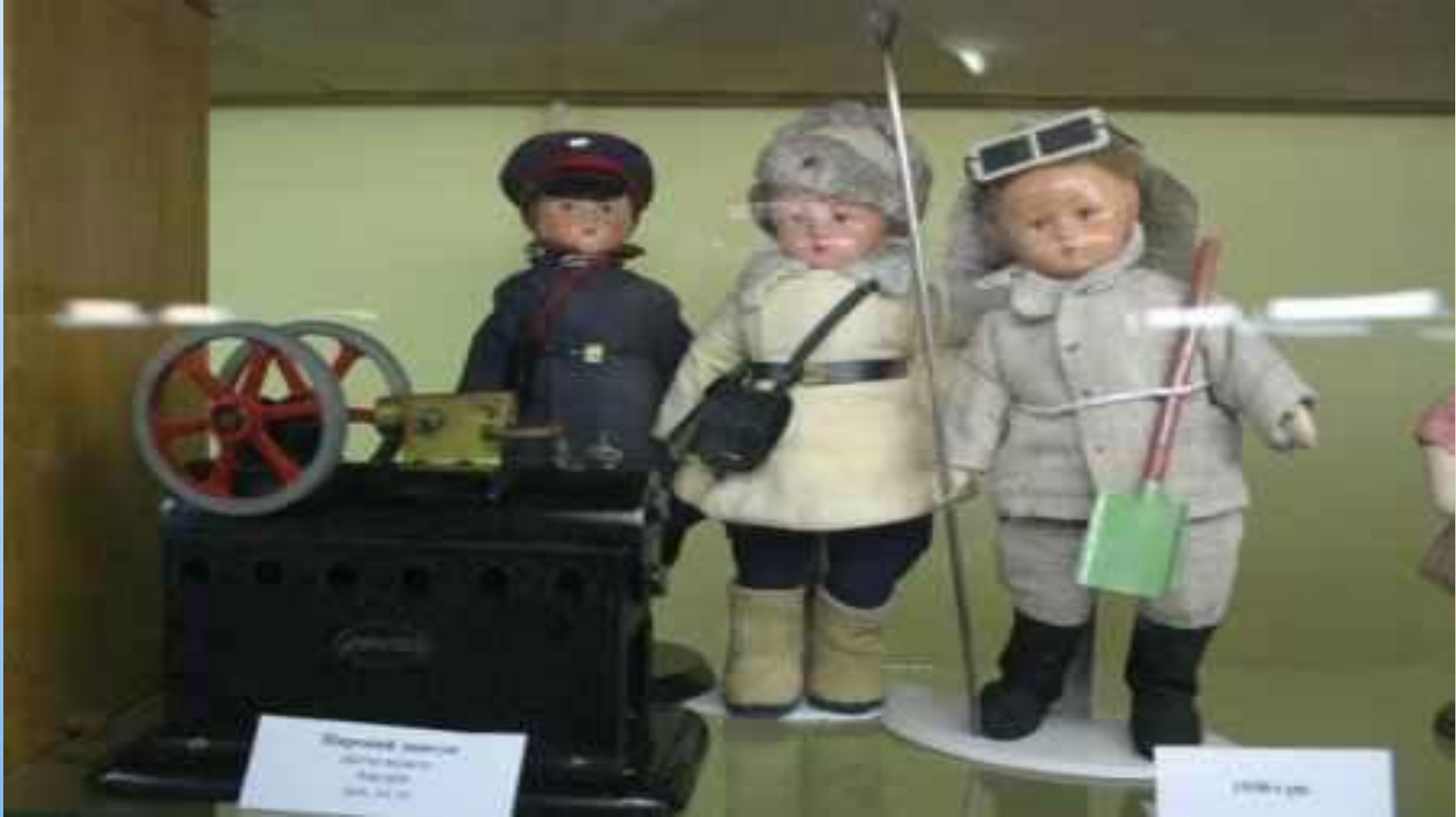
Экспонат музея Исторический костюм 1910-1915 гг.