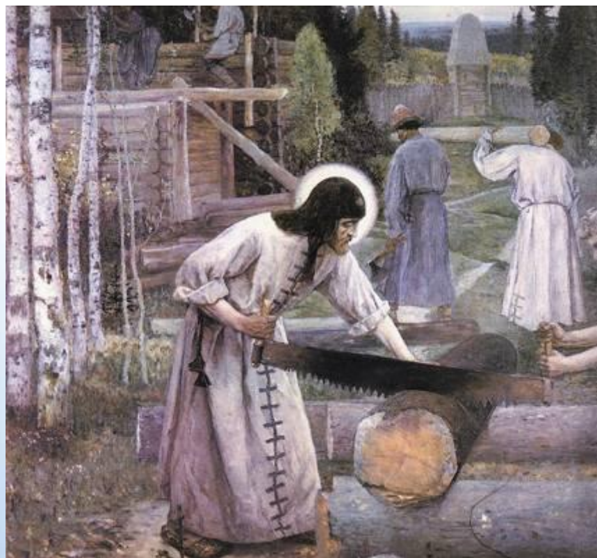
Сергий Радонежский на строительстве храма