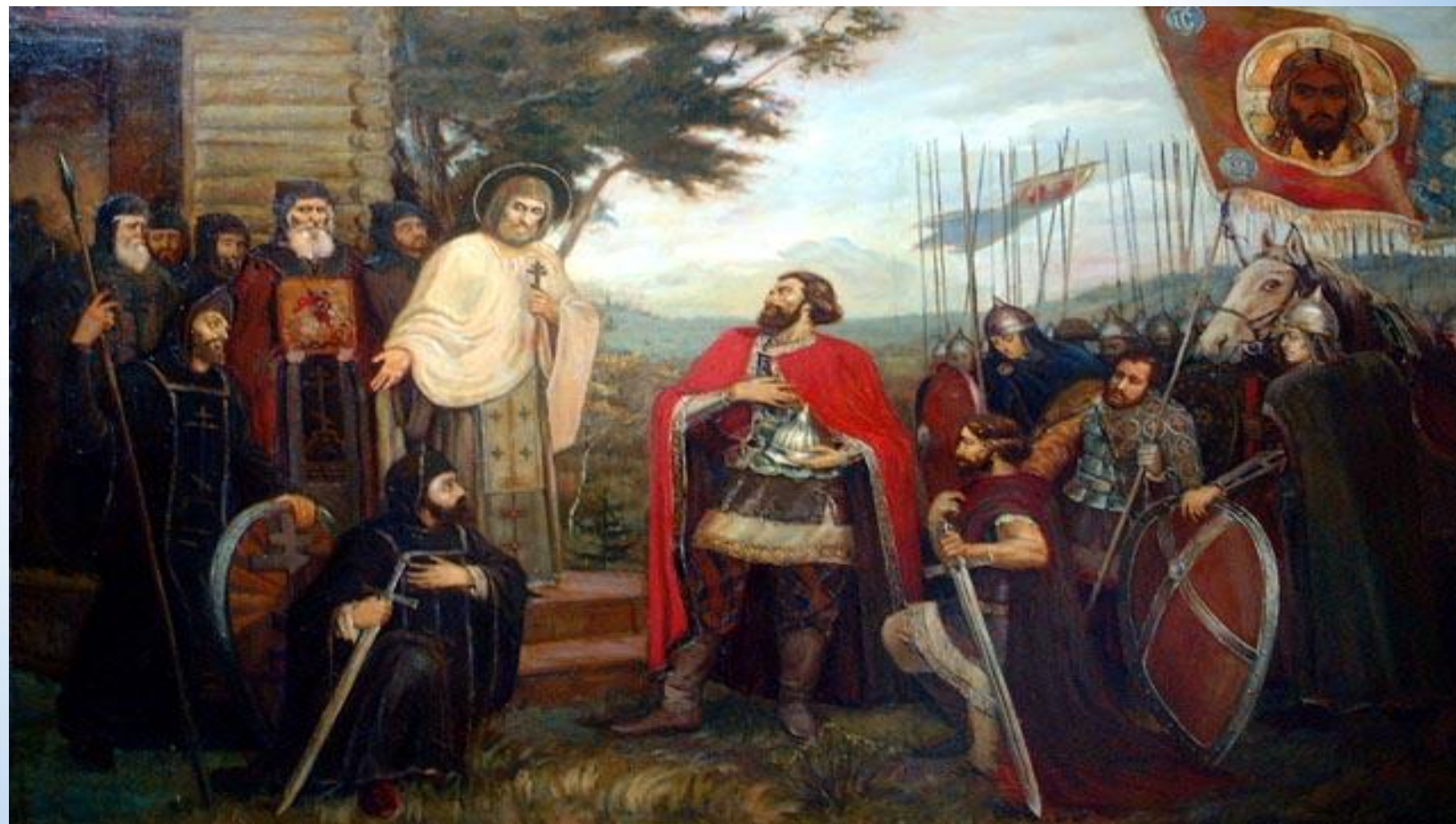
Сергий Радонежский благословляет Д.Донского на Куликовскую битву