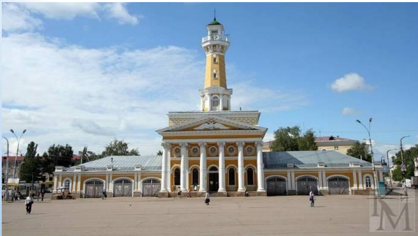
Пожарная каланча на Сусанинской площади