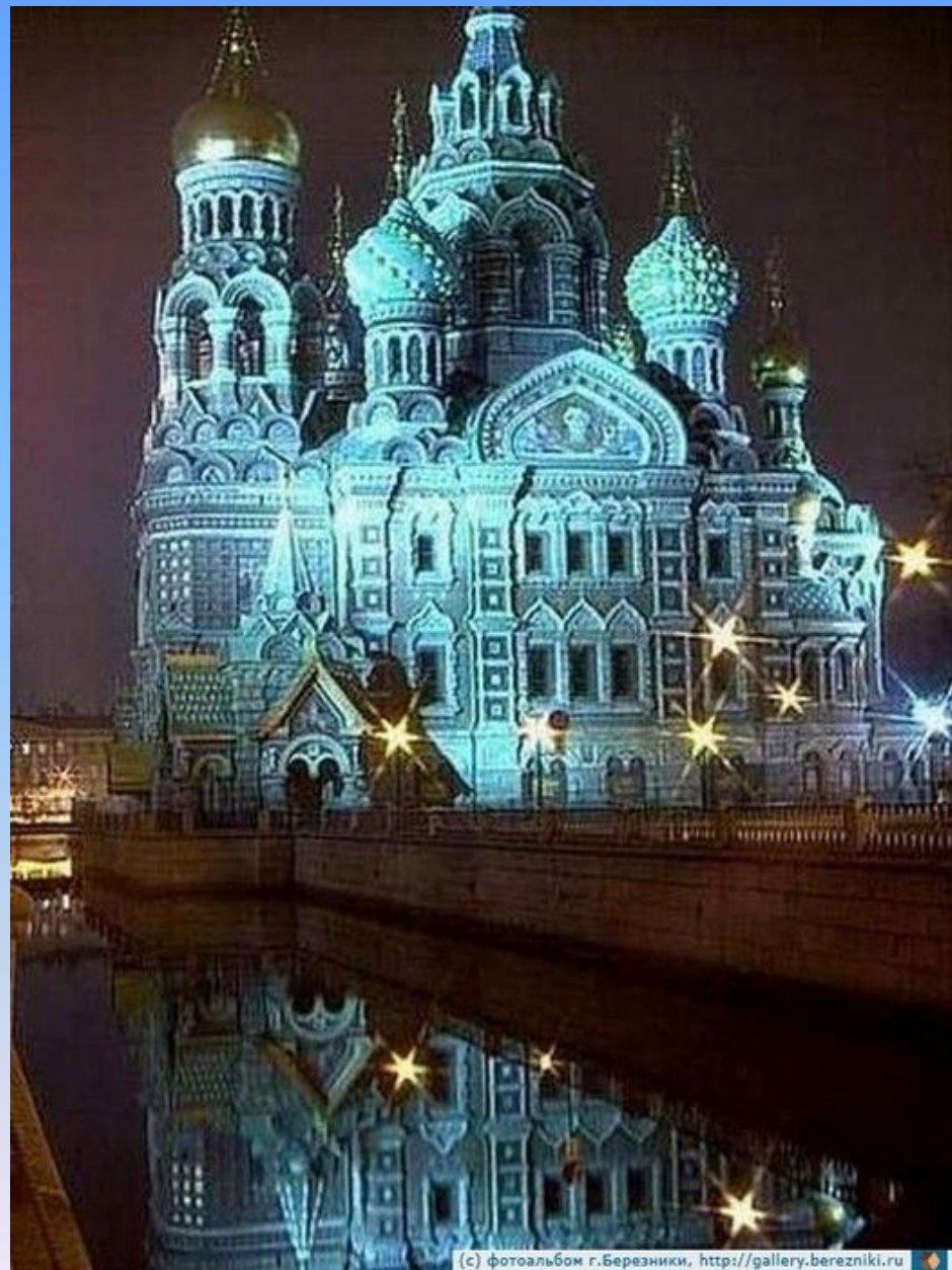
Храм Спаса на крови в Петербурге