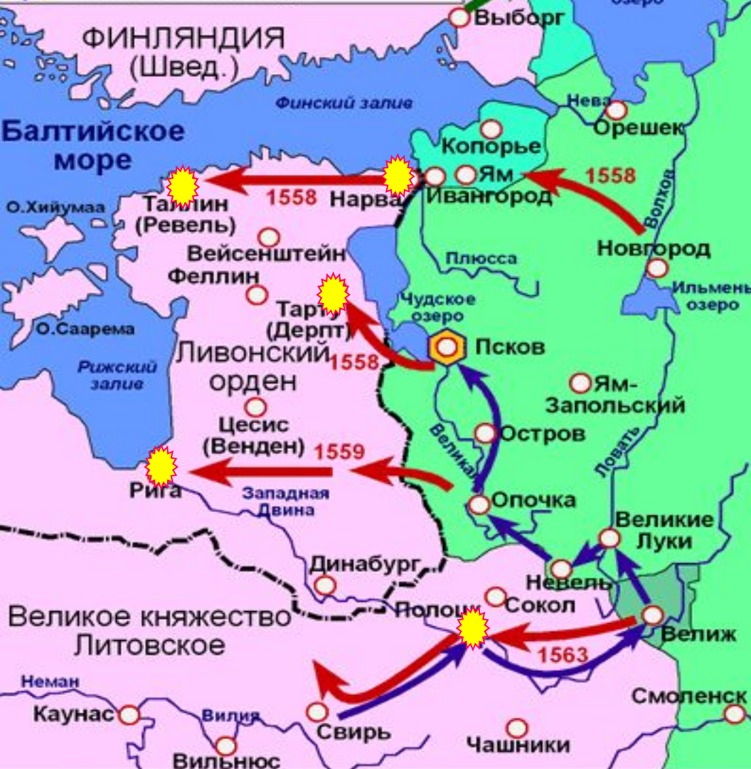
Территории утраченные Россией в результате войны