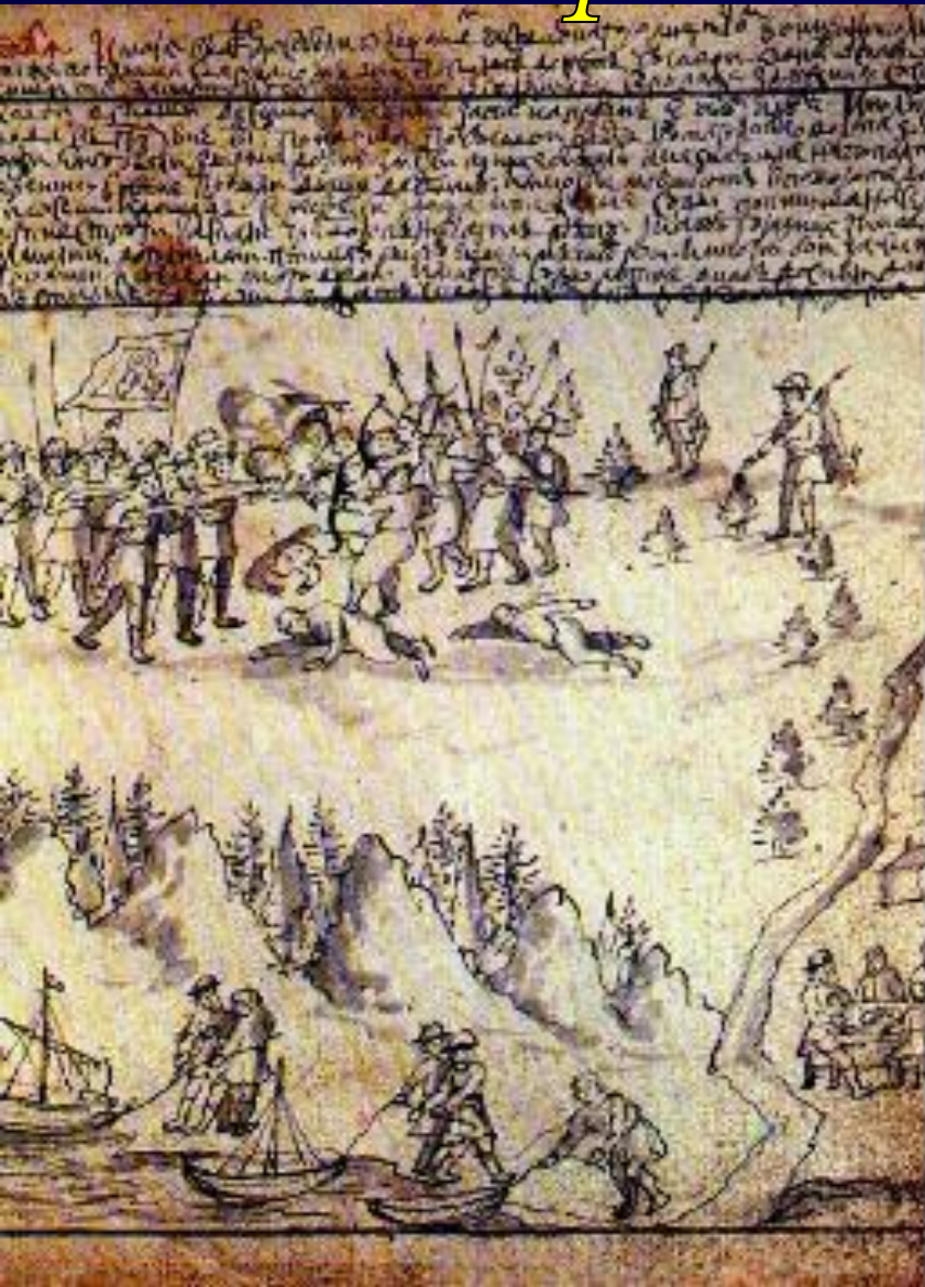
Казачи Ермака в Сибири Миниатюра 17 века.

В 1563 г. Сибирским ханом стал Кучум. Он превратил выплату ясака и возобновил набеги на русские земли. Строгановы набрали отряд казаков.