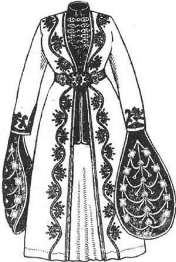
Праздничный женский костюм

Верхнее женское платье имеет прямую спинку со сплошным разрезом спереди. На бедра подвязывался орнаментальный бархатный передник.