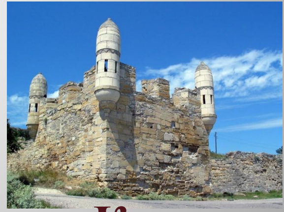
Евпатория Феодосия Керчь