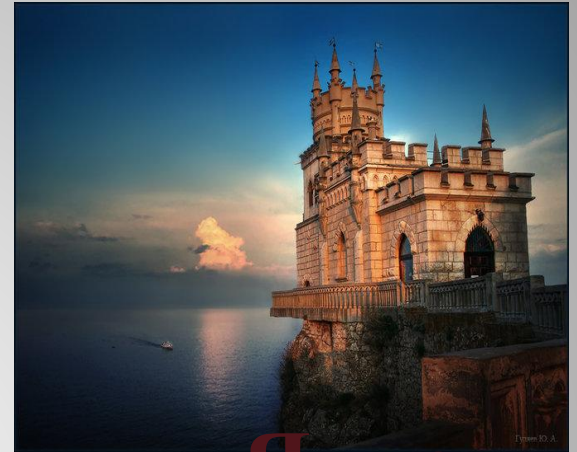
Севастополь Симферополь Ялта