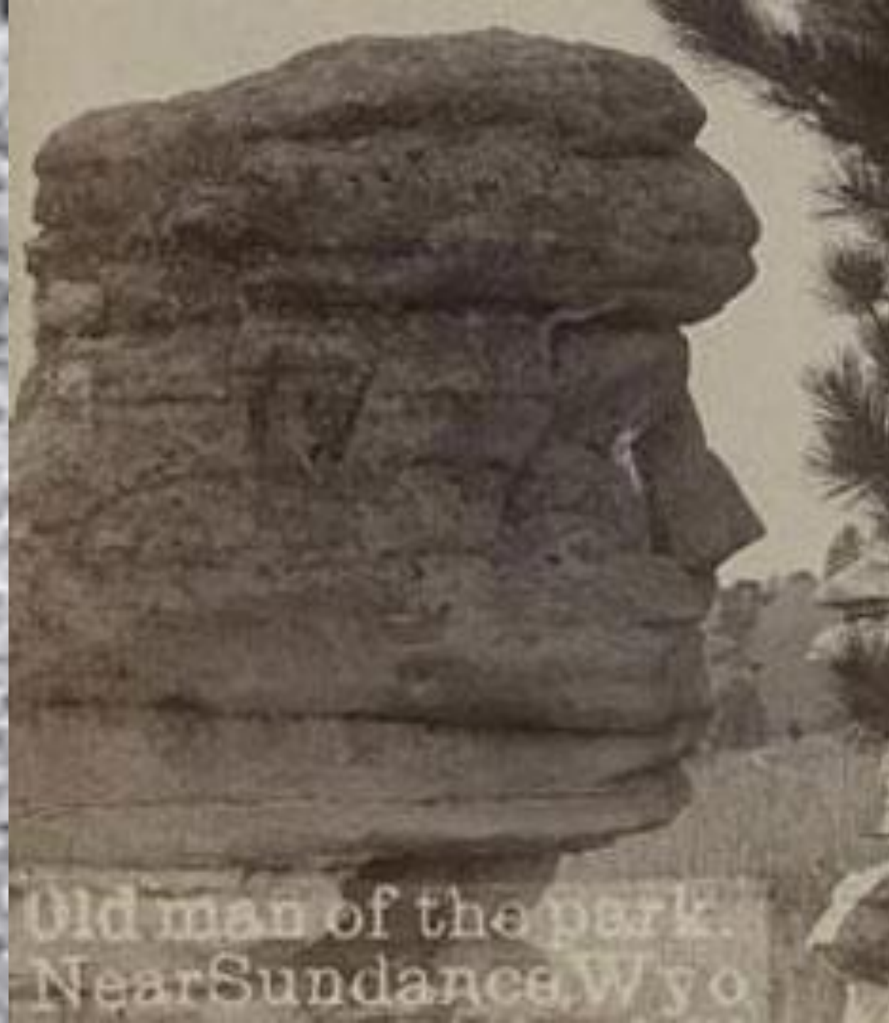
Old man of the park. Near Sundance, Wyo.