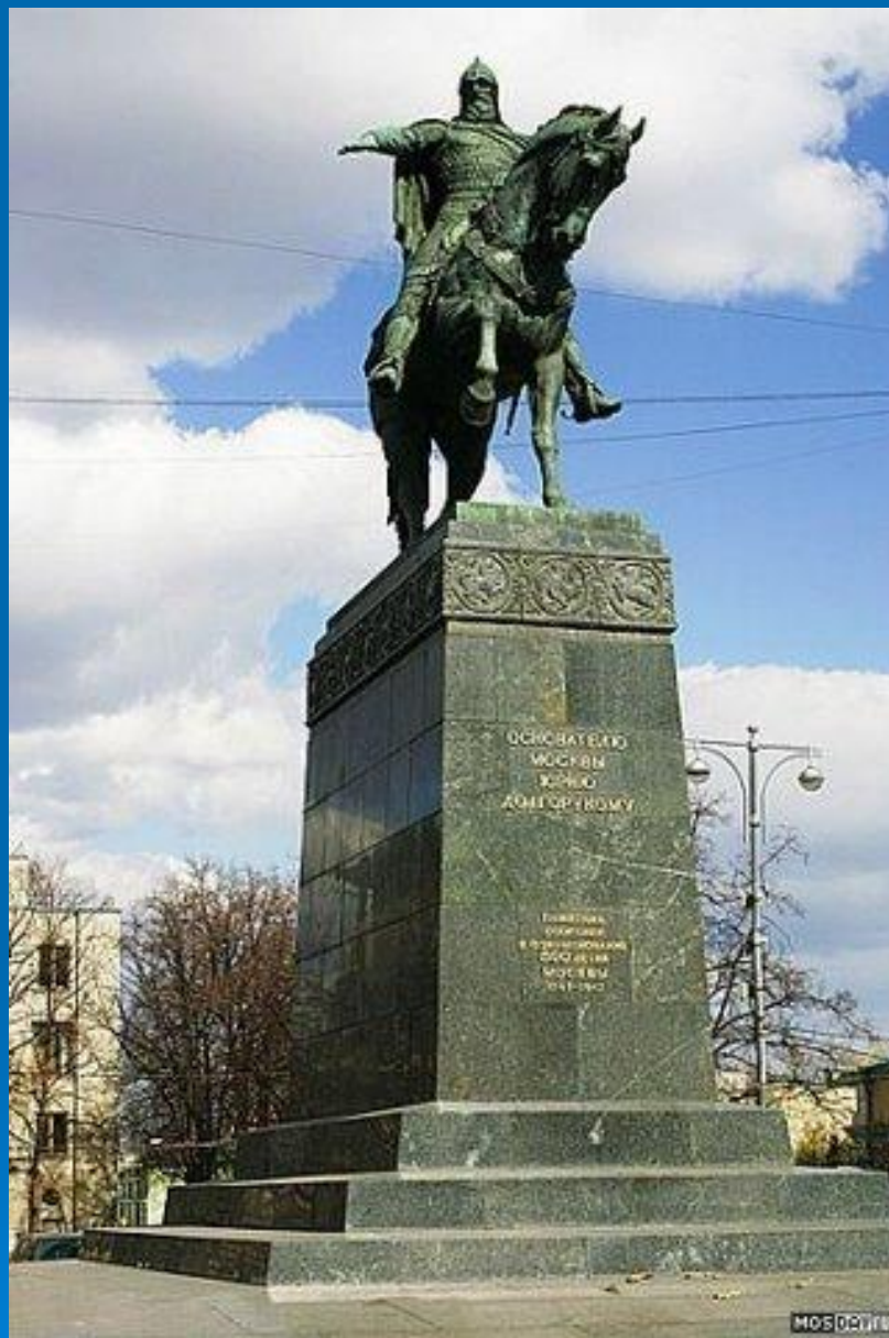
Памятник Юрию Долгорукому