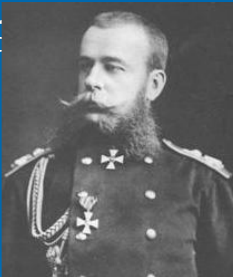
Михаил Дмитриевич Скобелев