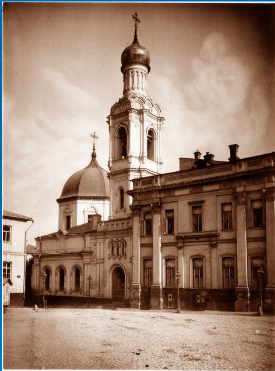
Храм в 1881 году