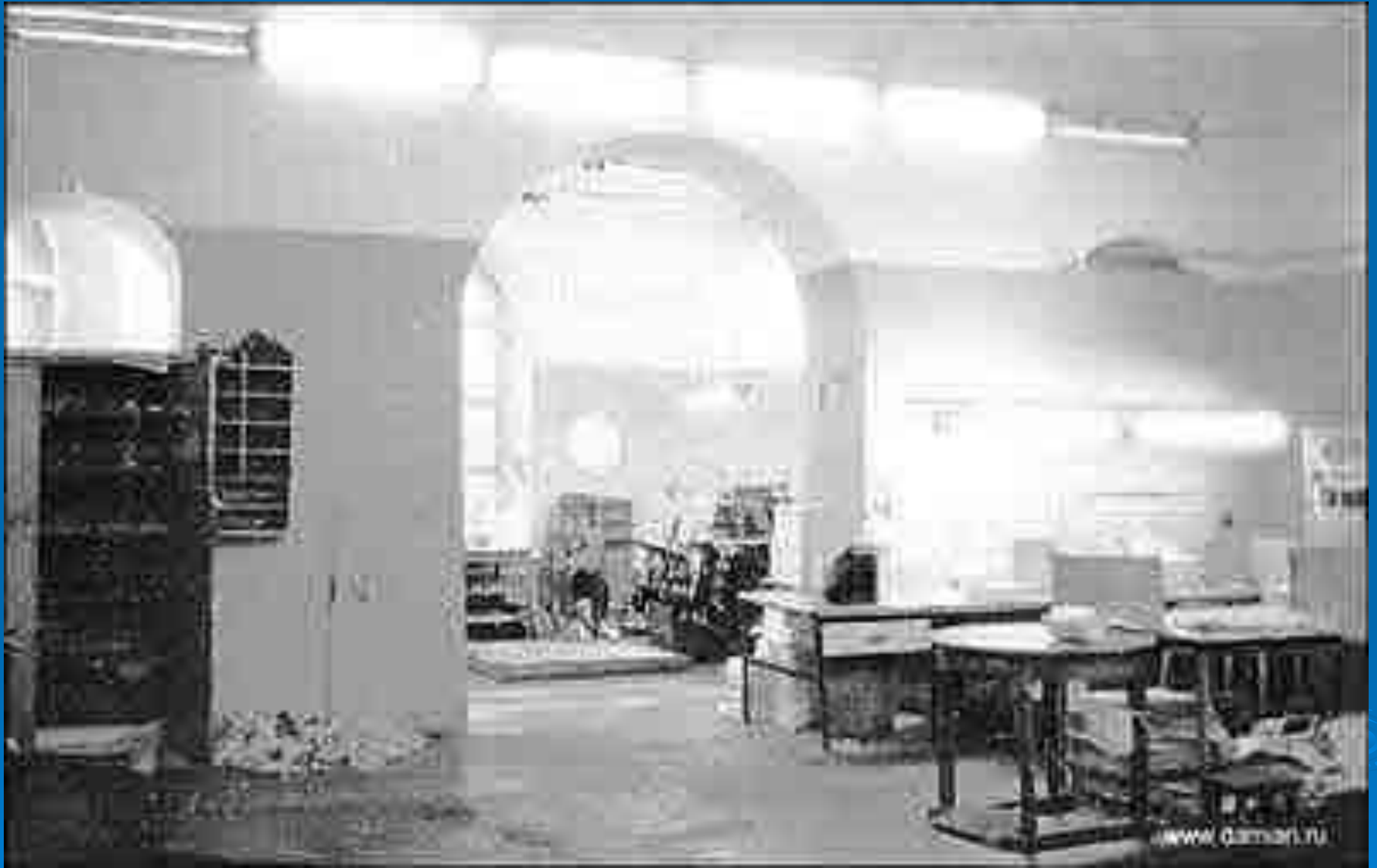
Храм в 1991г.