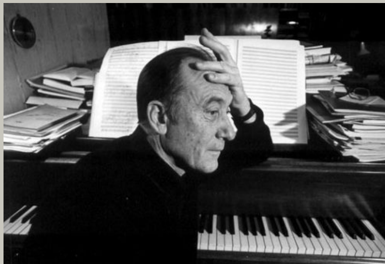
Родион Щедрин (р. 1932)