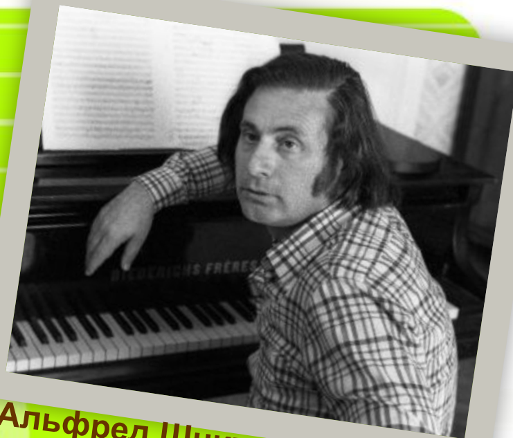
Альфред Шнитке (1934-1998)