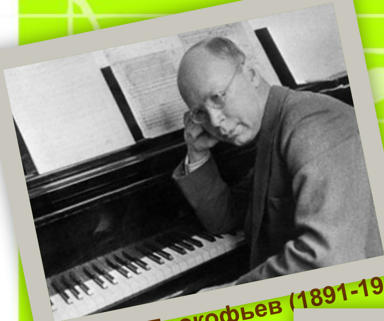
Сергей Прокофьев (1891-1953)