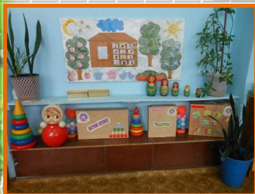
Кабинет учителя логопеда