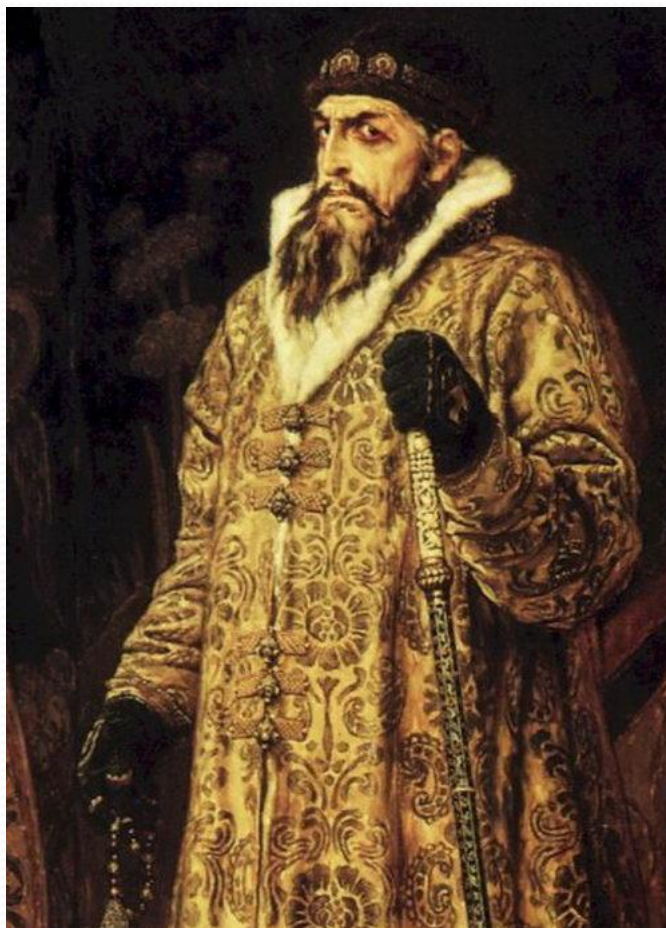
С.М.Васнецов «Иван Грозный»