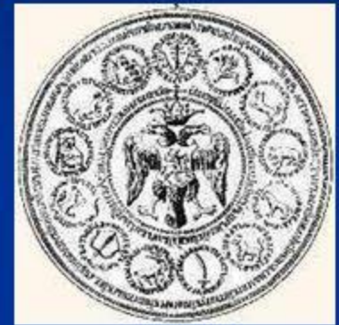
Печать Ивана Грозного