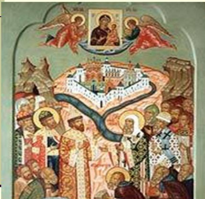
М. Б. Шабает. Икона «Встреча Ивана Грозного с митрополитом Макарием»