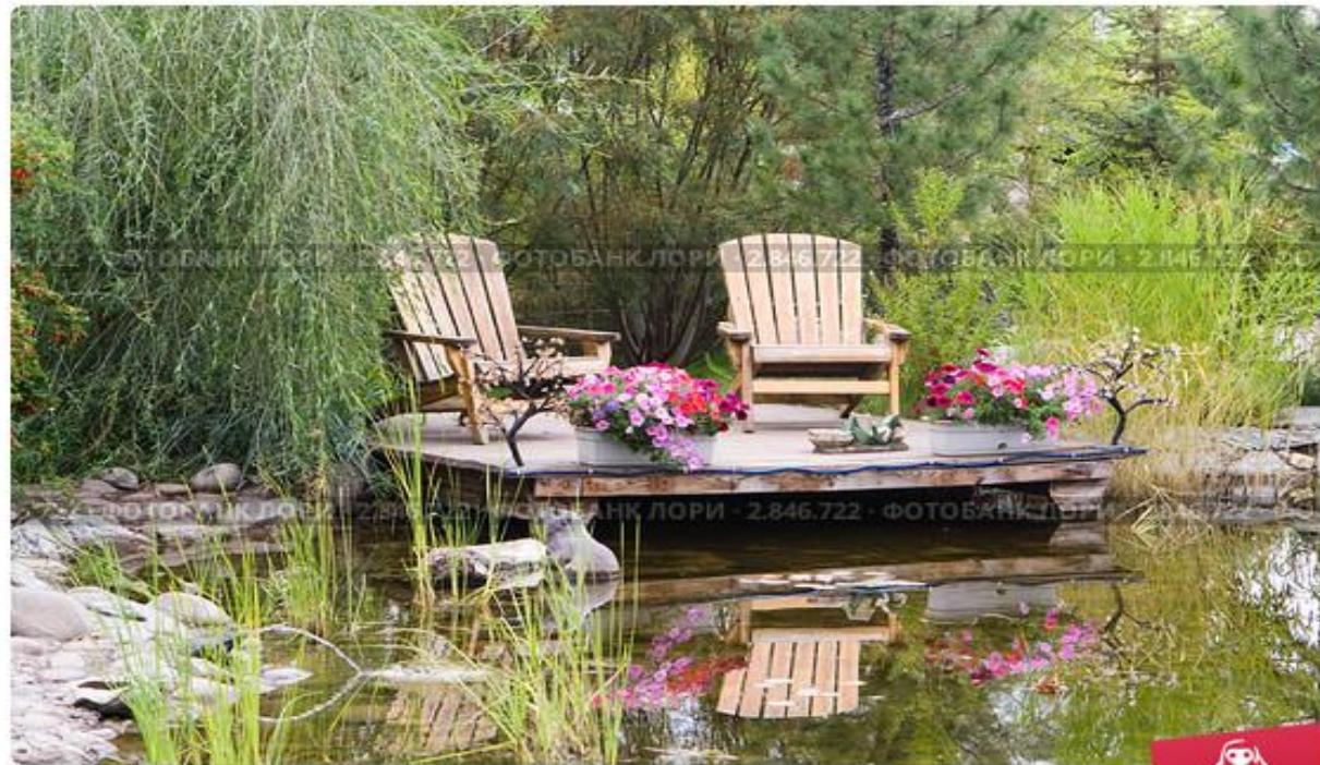
Абакан. Ландшафтный парк "Сады мечты". Место отдыха у пруда