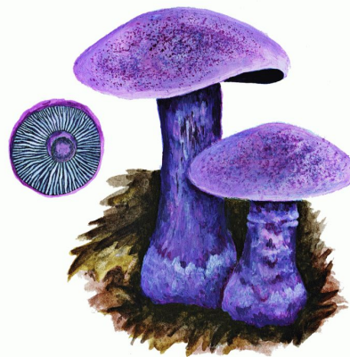
Паутинник фиолетовы й