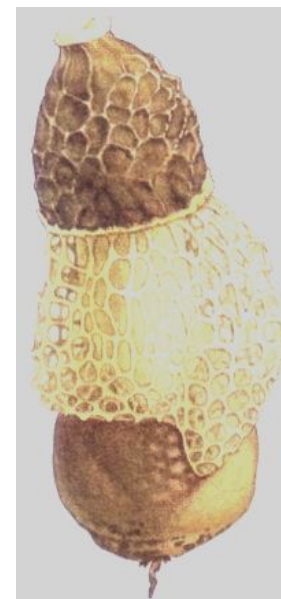
Сетконоск а сдвоенная