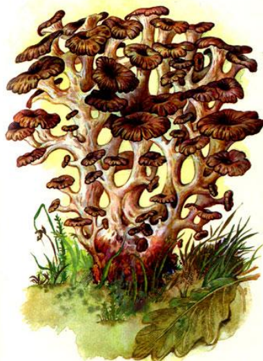
Грифол а курчава я